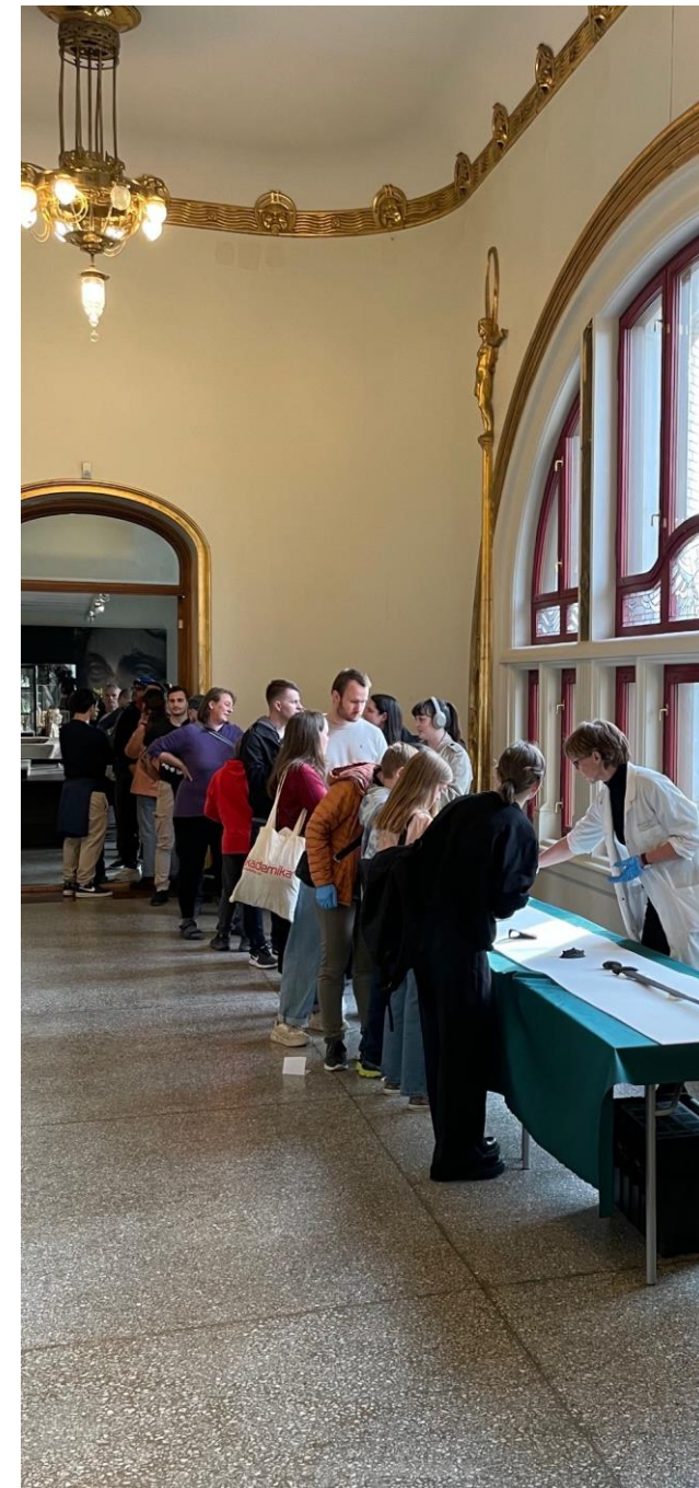
Fra arrangementet «Kjenn på Historien» høsten 2022, der det var stasjoner spredt rundt i Historisk Museum.