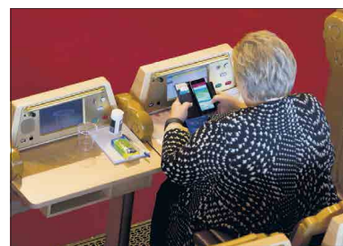
INN I LÆREPLANEN: Elevene vet ikke hvordan de best bruker mobilen i hverdagen eller på jobb, skriver forfatteren.