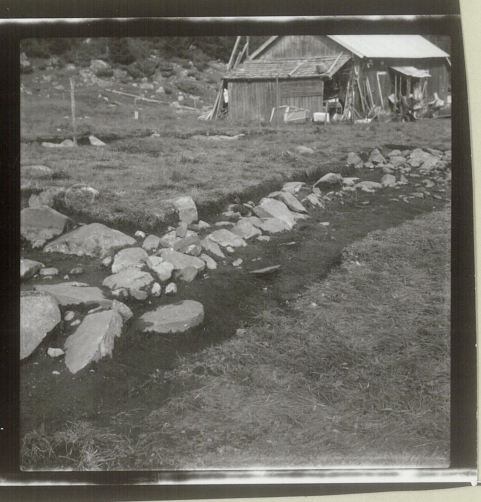
Sjålet 1. Nordre langvegg