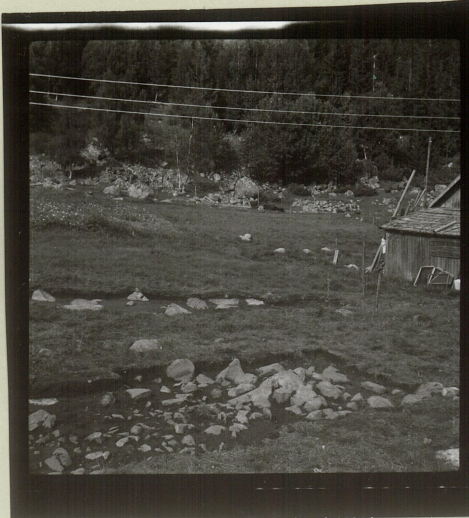
Sjålet 1 i forgrunn m. øvre del av stuekorps og ontatt inngangsparti (y-sjålet)