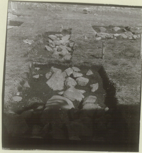
3. Veste kortvegg.