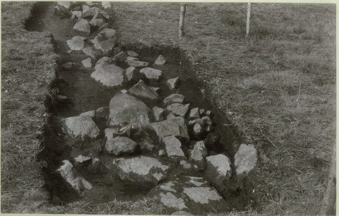
4. Söndre del av veste kortvegg.