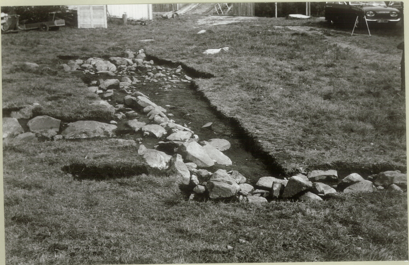
2. Den eldre tjuften. Sett fra Råilands- norden langs vegg. Stienes tjuft. vestre kottveg i lotgrønn.