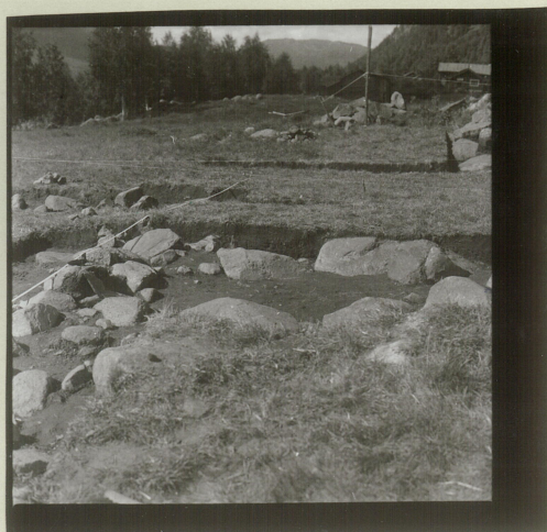
Sjalt 1. Do.