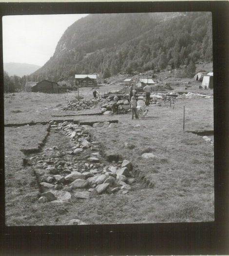
Sjålet 1. (y-sjålet)