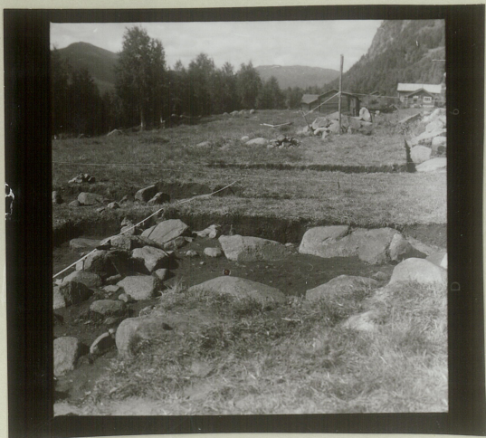
Sjalt 1 (Y sjalt) vestu del norðurlangveg, m. "tilbyggj"