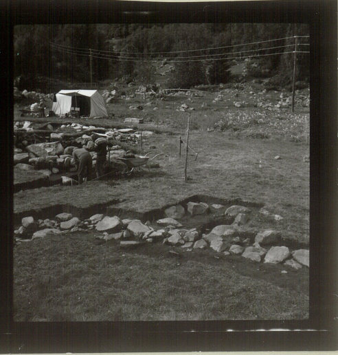
Sjålet 1 vestre del Nordre langvegg - nord vestre hjørne "Tilbygg" og no. del av vestre Kortveg.