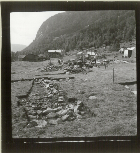
Sjålet 1 (y-sjålet) m. Raülend steinstuft i bakgrunnen