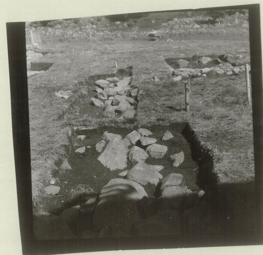
Sjalt 1. (X - sjalt) profil (ille teygnet) (= X 5.3)