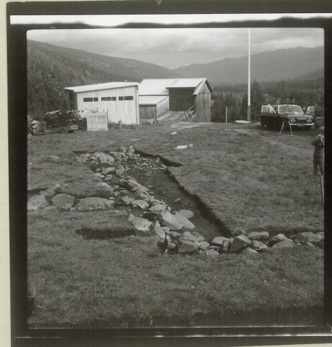
Sjålet 1 y-sjålet + øvre del x-sjålet sett fra Raülend steinstuft.