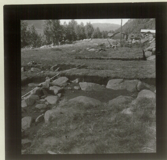
Sjalt 1. Do.