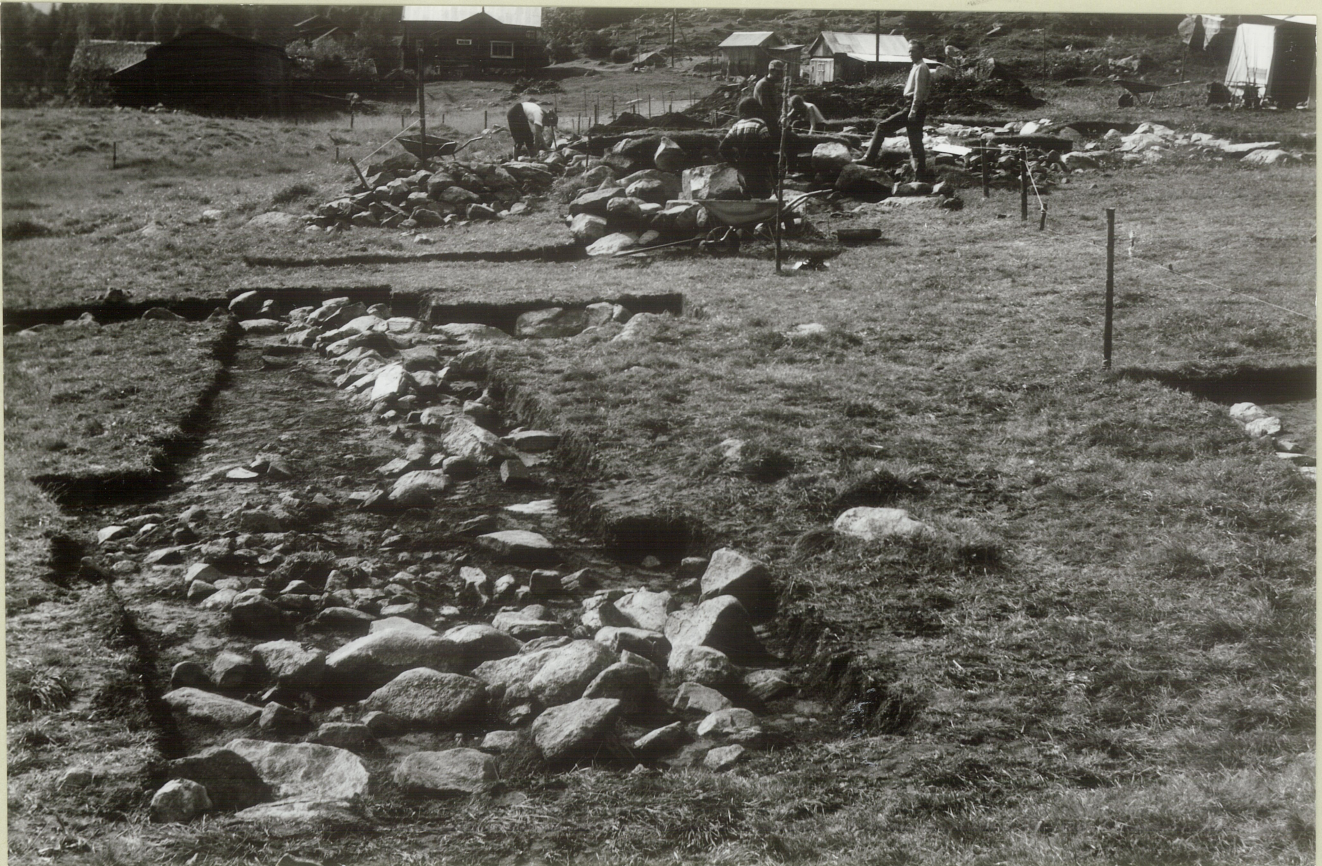
1. Sidiasjons kilde. Råilands tjuften i baligrånnen