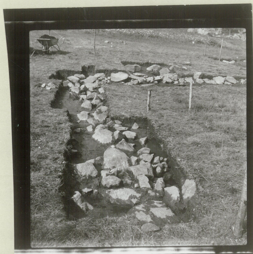
Sjalt 1 (X - sjalt) vestu kortvegj