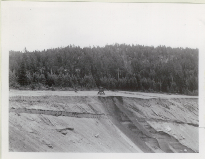
A.W.B. foto. 30/6. 1938.