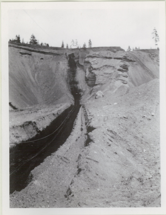
A.W.B. foto. 30/6. 1938.