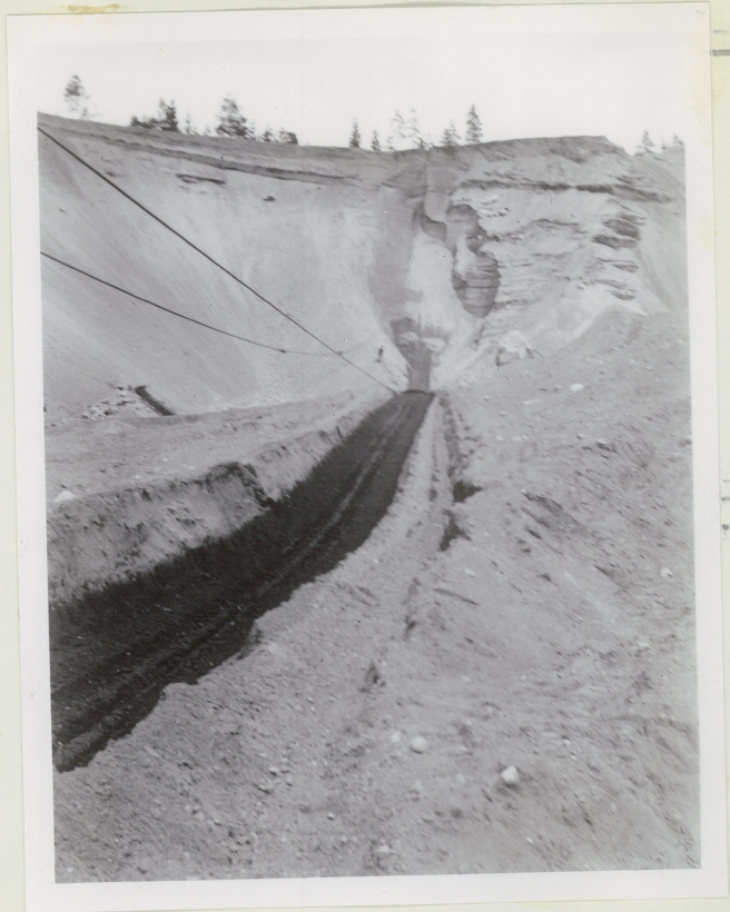
30/6. 1938.