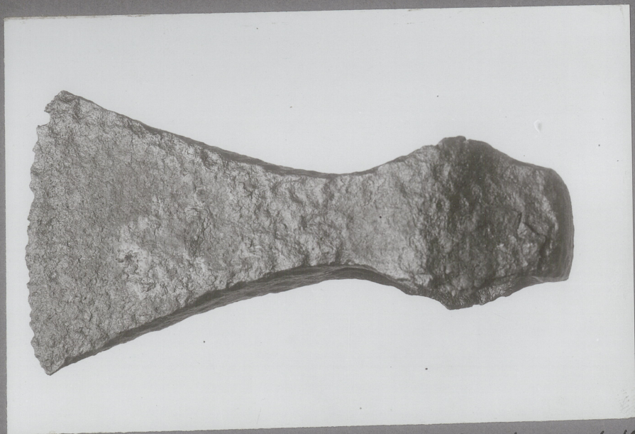
Evenstad, Prestfoss, Sigdal, Buskerud 1943