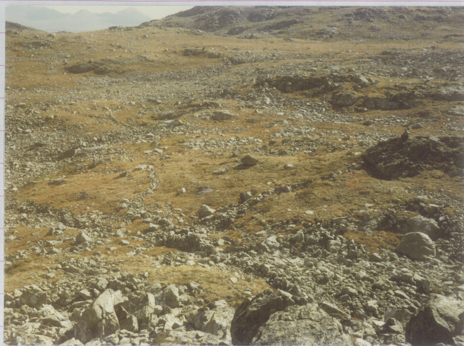
Foto fra nord-nord-vest. Dyregrav II med leiegjerdes Eine leiegjerdet til grav III Syner i bakgrunnen til venstre