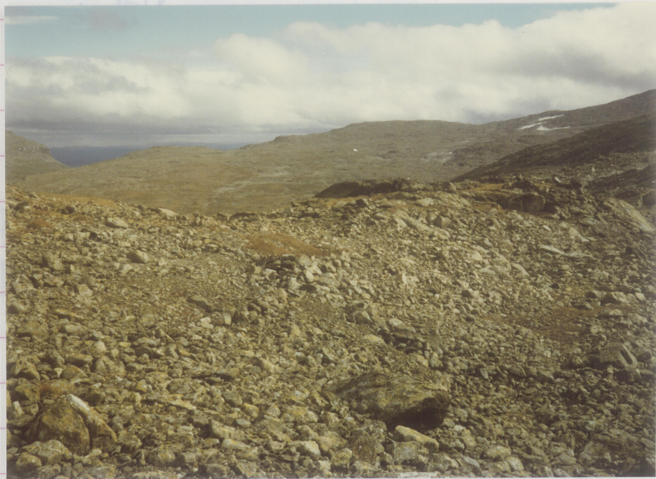
Foto fra nord-vest, fra steinen som er nevnt på s. 18. Løve- Lauvdalsbrua i bakgrunnen til venstre.