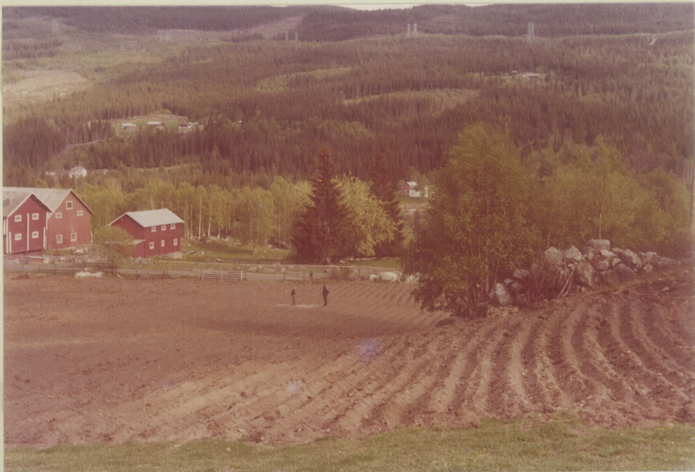
Funnstedet ved personene