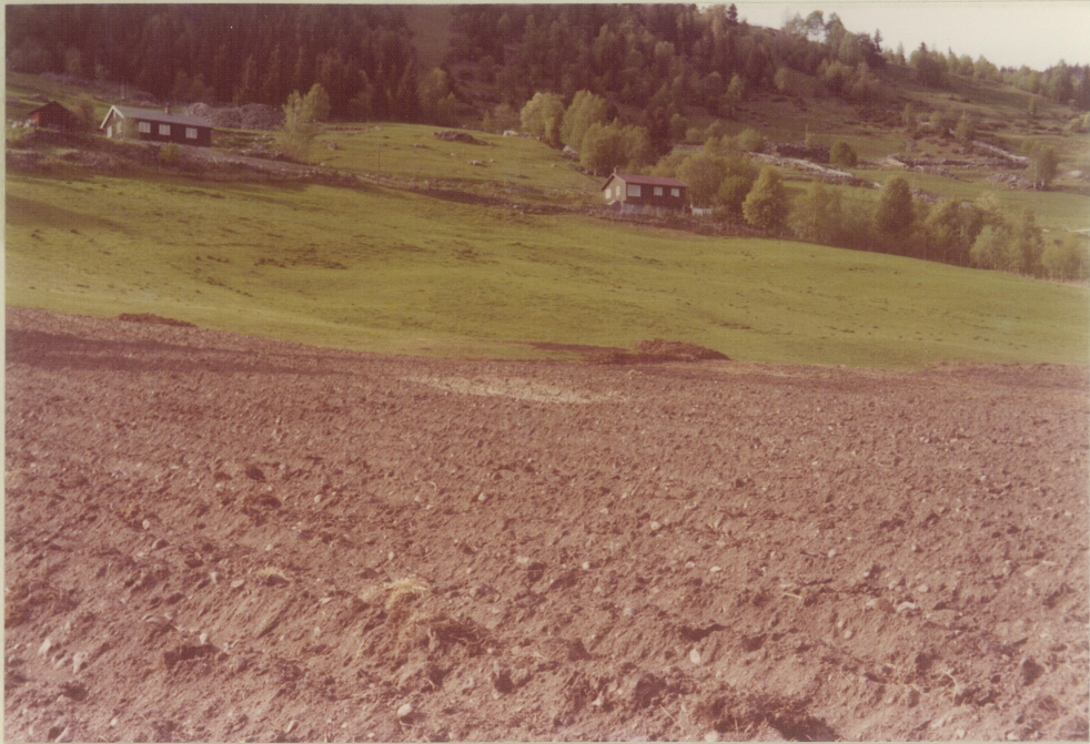
Funnstedet er den lyse flukken i åkoren. Fra SV