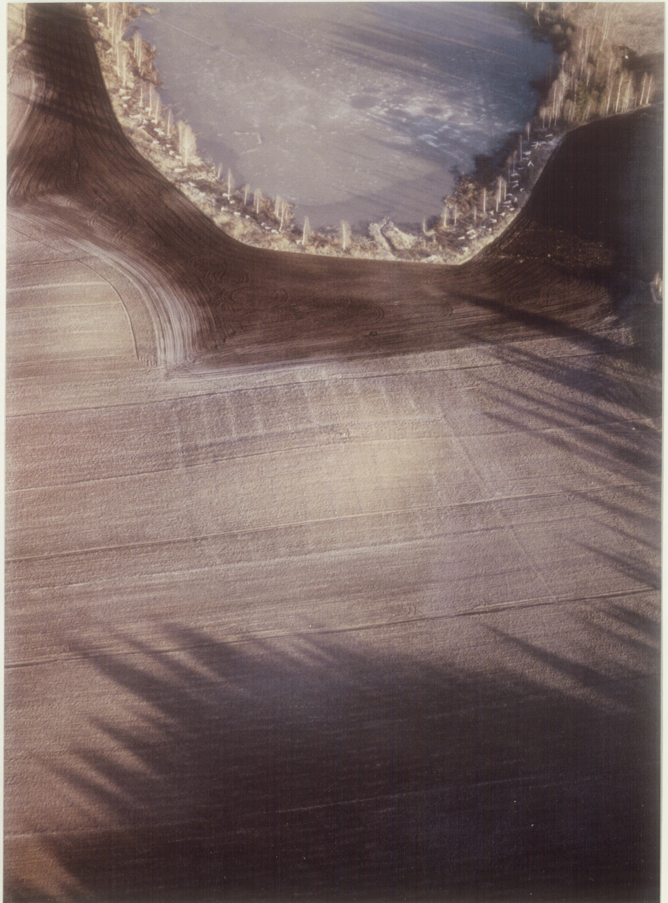
Haugen fra N. Solberg tjernet i bakgrunnen.