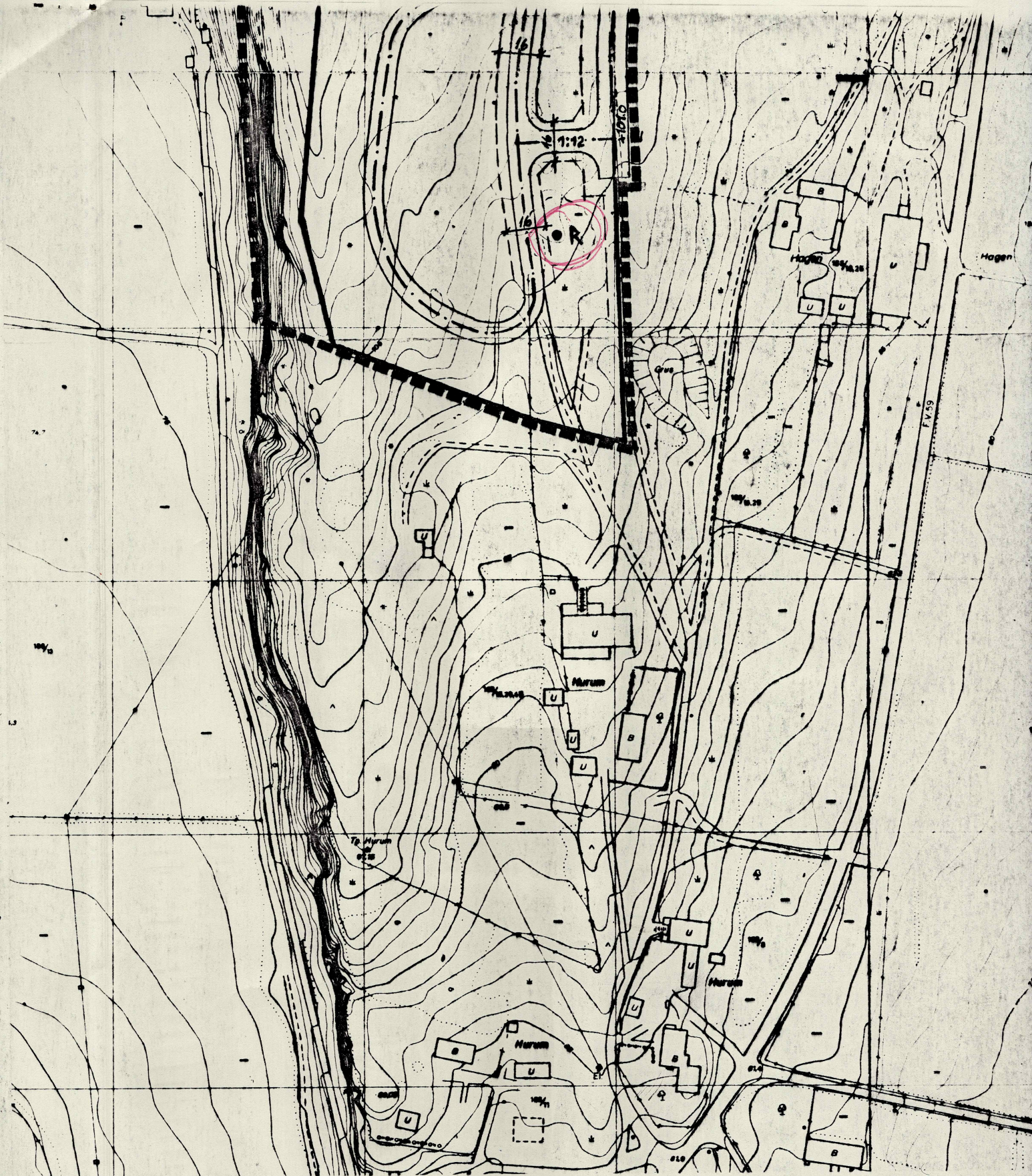
Utsnitt av reguleringskart m 1-2000 "Reguleringsplan for Hurumåsen" basert på ØK CK 050-1-59