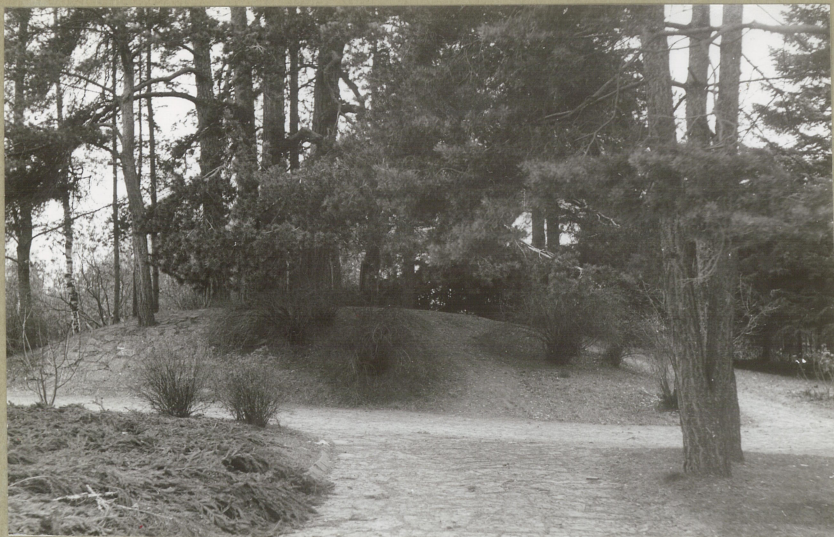
HAUG 4 FRA SYD