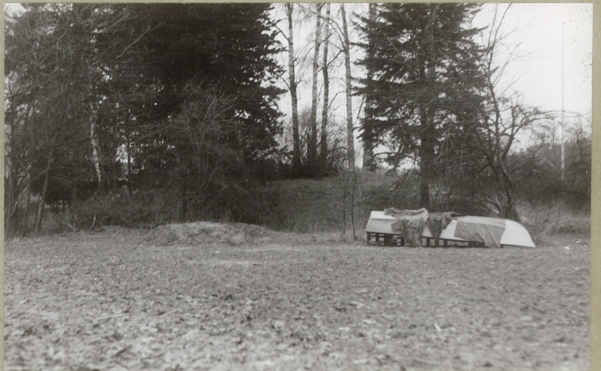
HAUG 2 FRA ØST