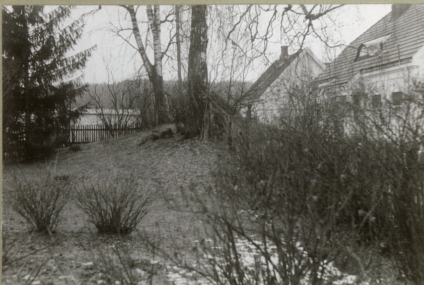
HAUG 3 FRA NORD