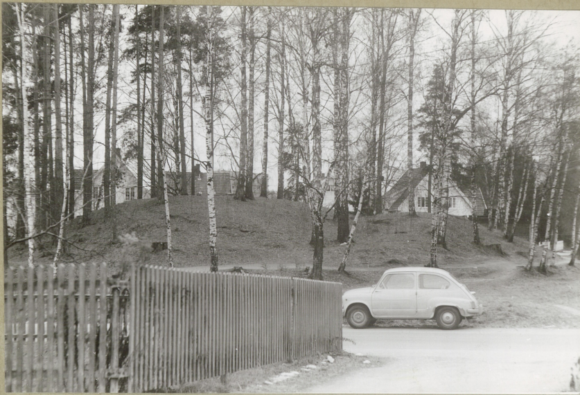
GRAVHAUGER I HØNEFOSS.