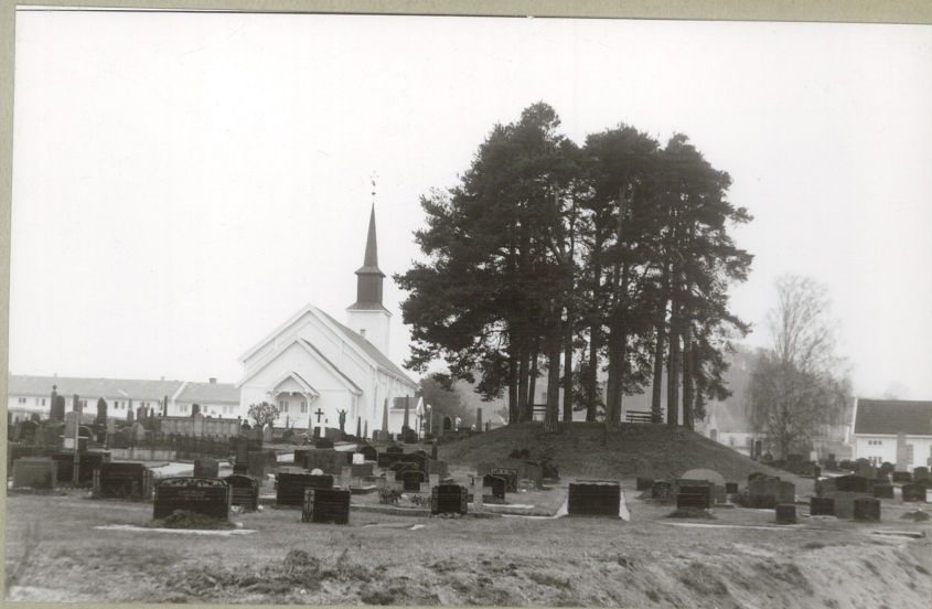
HAUG 5 FRA ØST