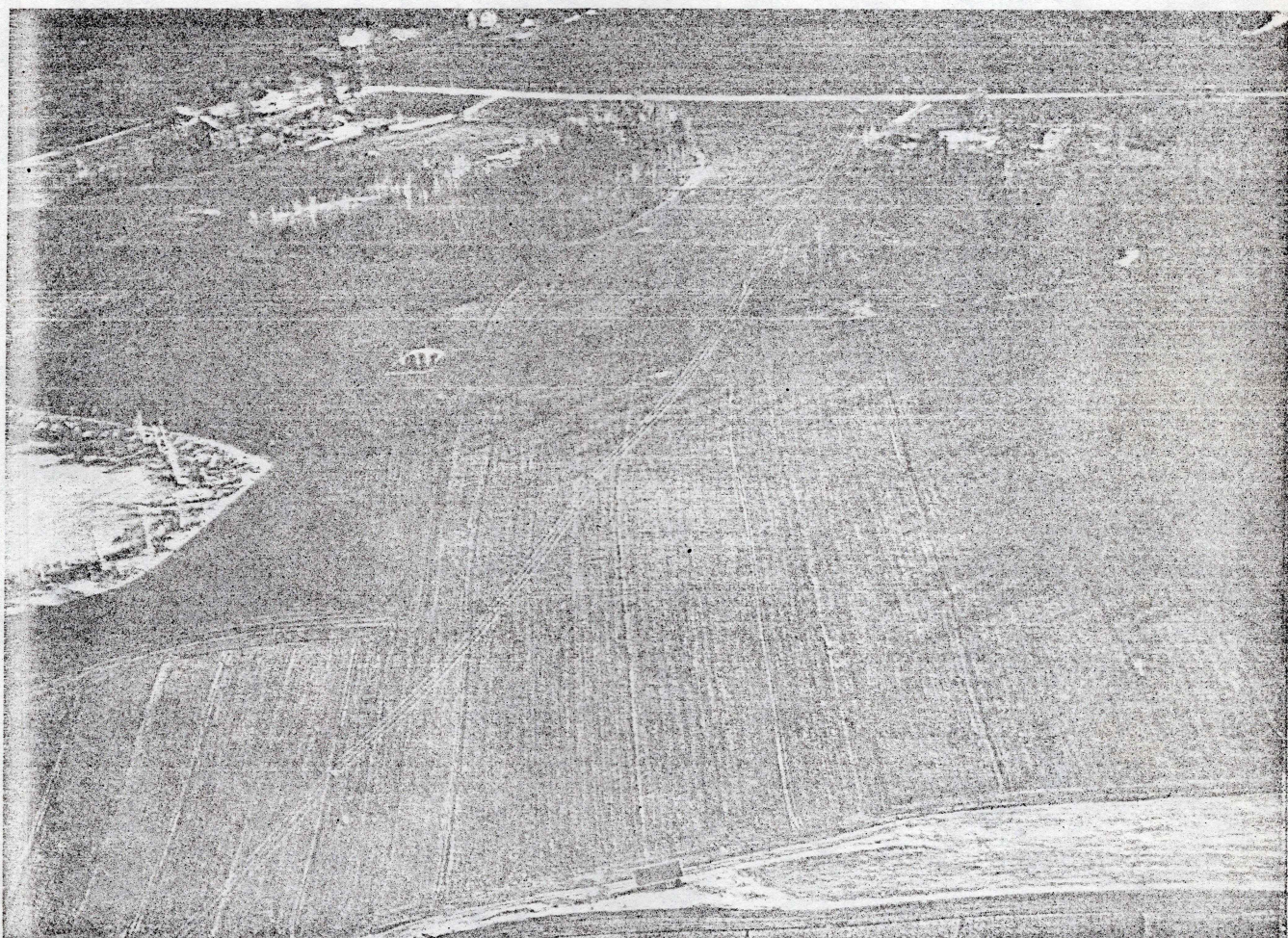
Haugen fra \emptyset . Masten midt på bildet er toppen av haugen.