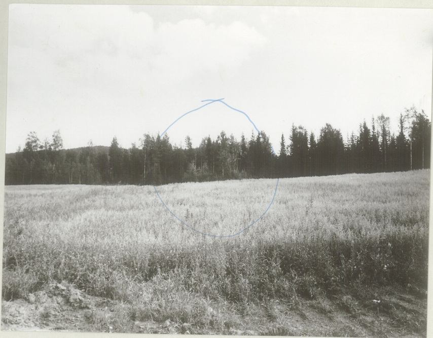
Gravhøyen fra V.