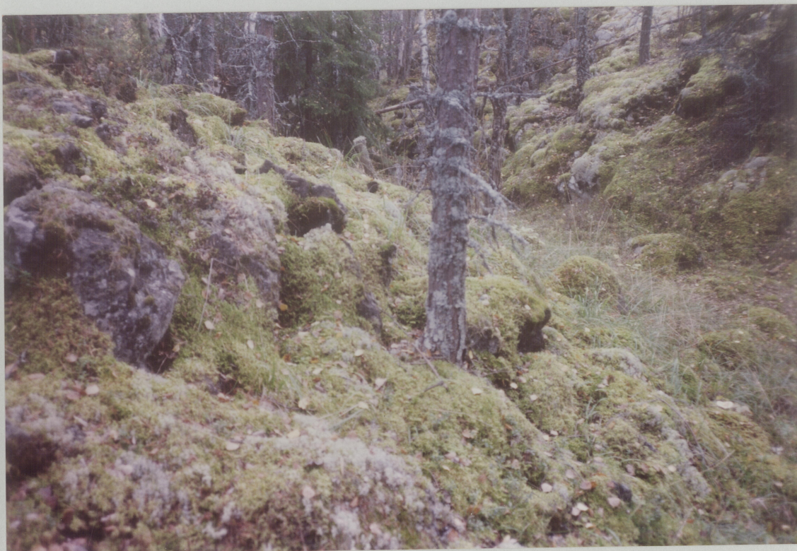
NR 6. MOT SYD OG VISED TIL HØYRE TOTE N AV SKRENTEN DE FØRIGE BILDENE ER TATT FRA.