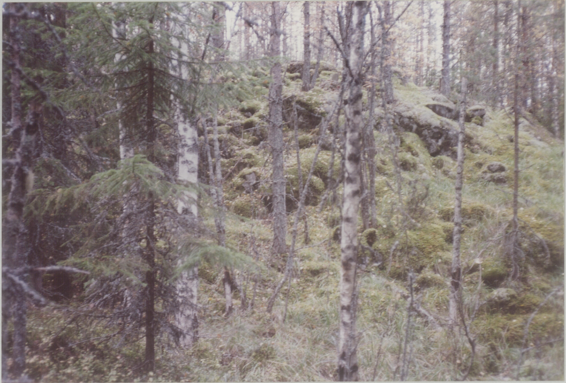
NR. 9. MOT NORDVÆST