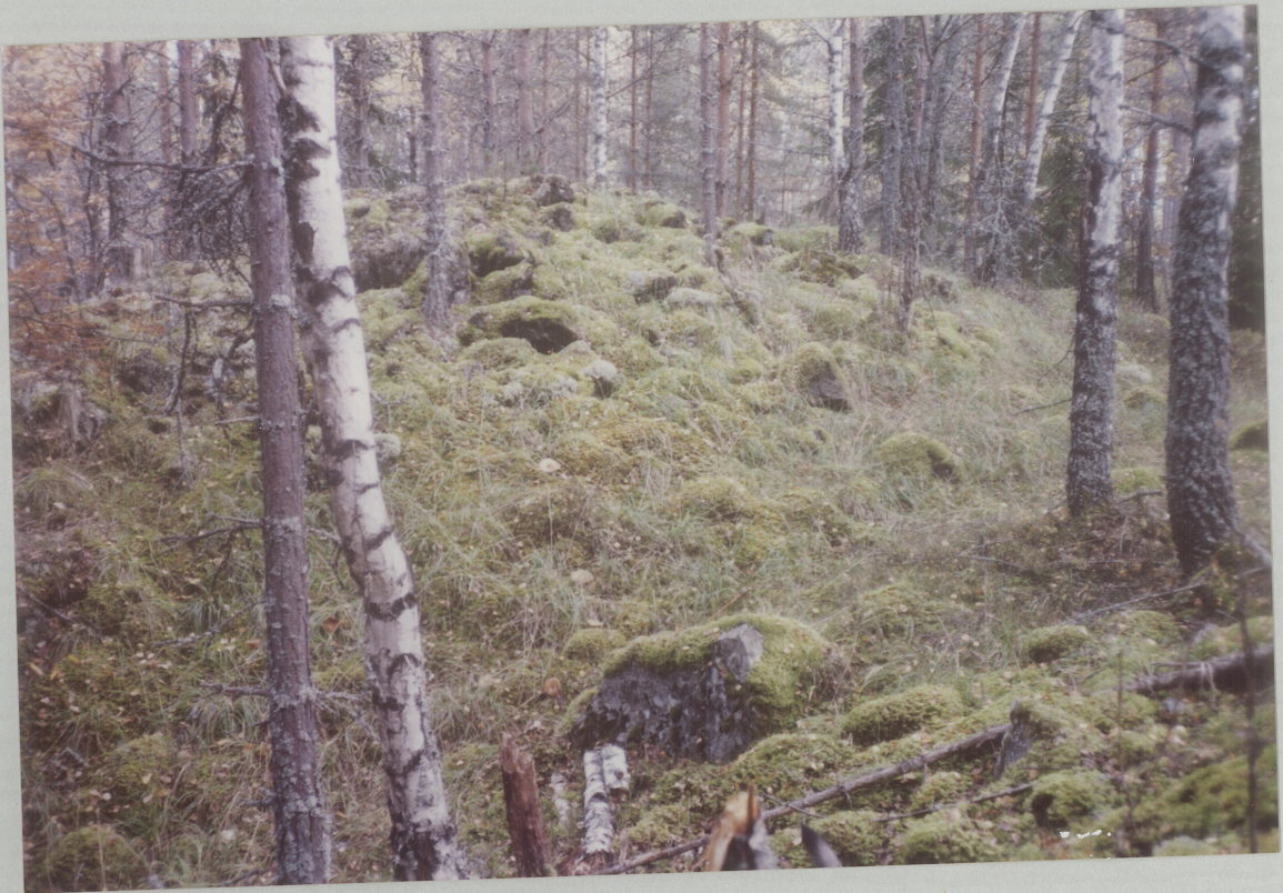
NR. 12. MOT SYDØST