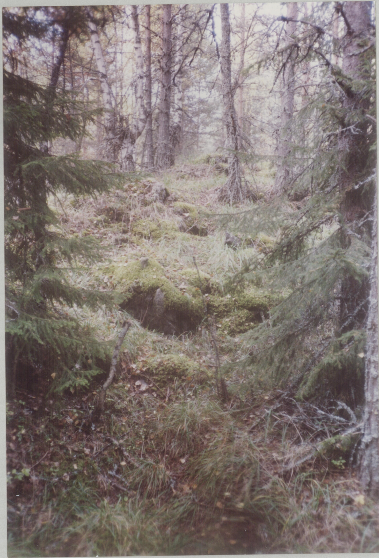
NR. 7. HAUGEN TATT MOT NORD