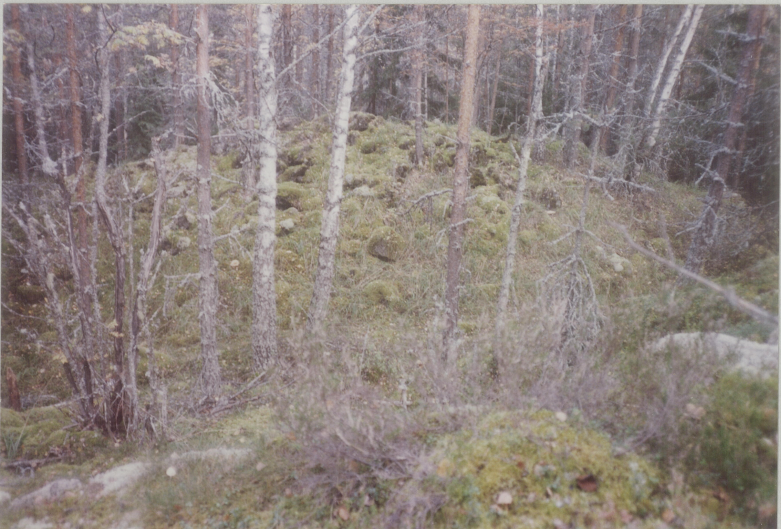
4. MOT SYDØST, TATT LENGER NORD