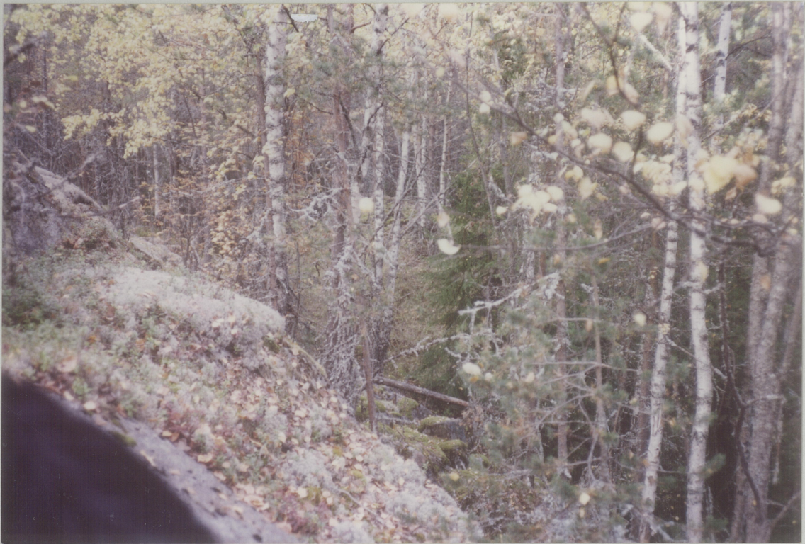
3. MOT NORDØST, TATT LENGER SYD FRA SAMME SKRENT SOM 2.