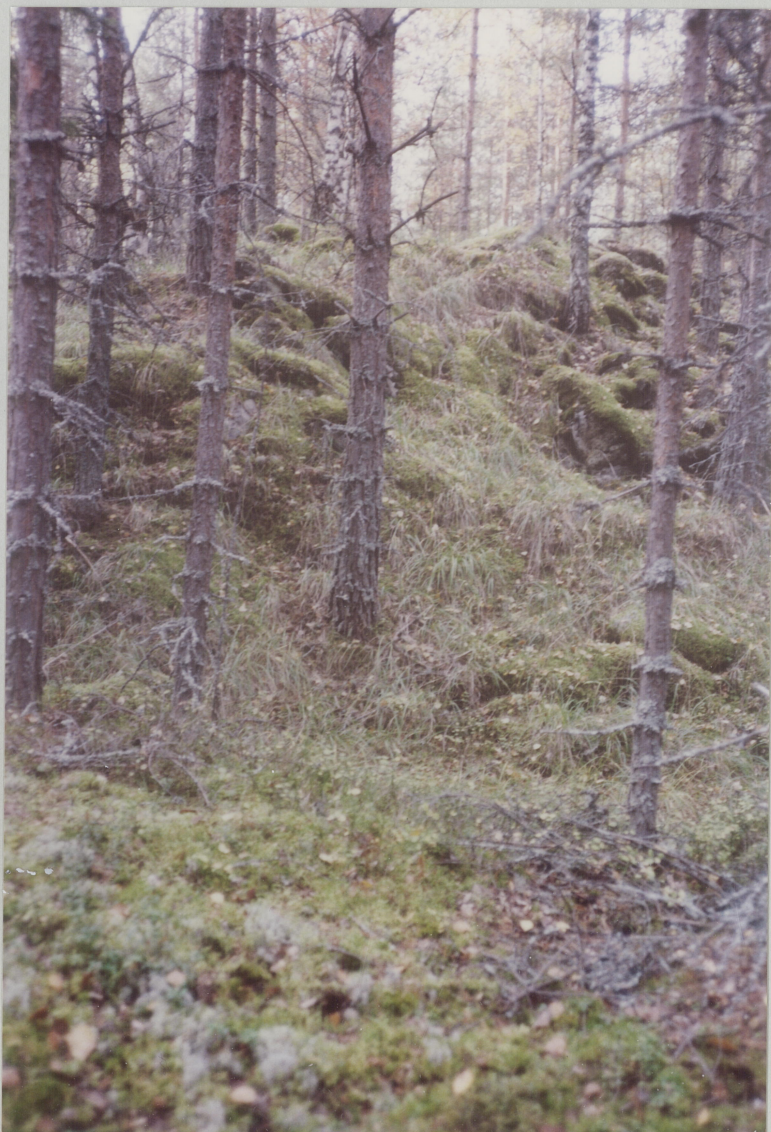
NR.15 MOT NORDVEST