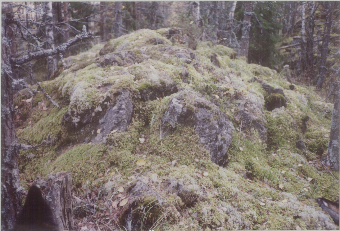
NR. 10. TOPPEN AV HAUGEN, MOT SYDVÆST