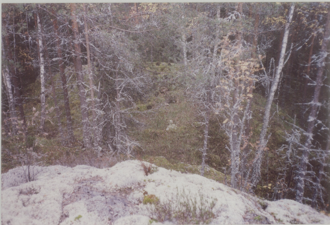
2. MOT NORDØST