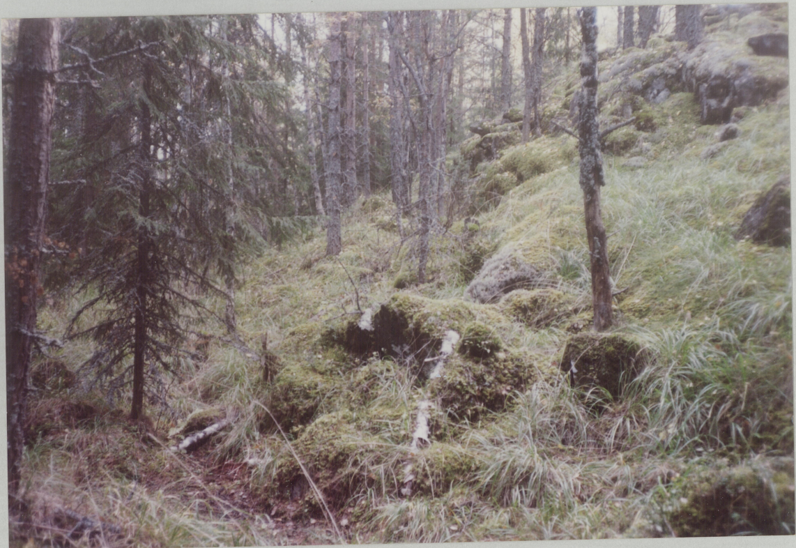
NR. 8. MOT SYD, ØST-SIDEN AV HAUGEN