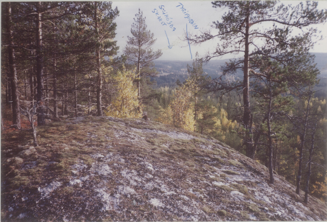
MOT SYD 1. TATT FRA STOR HAUGEN, ISOM SV FORTUNNET

STOR HAUGEN, HEN, 271/30620, RINGERIKE K., BUSKERUD