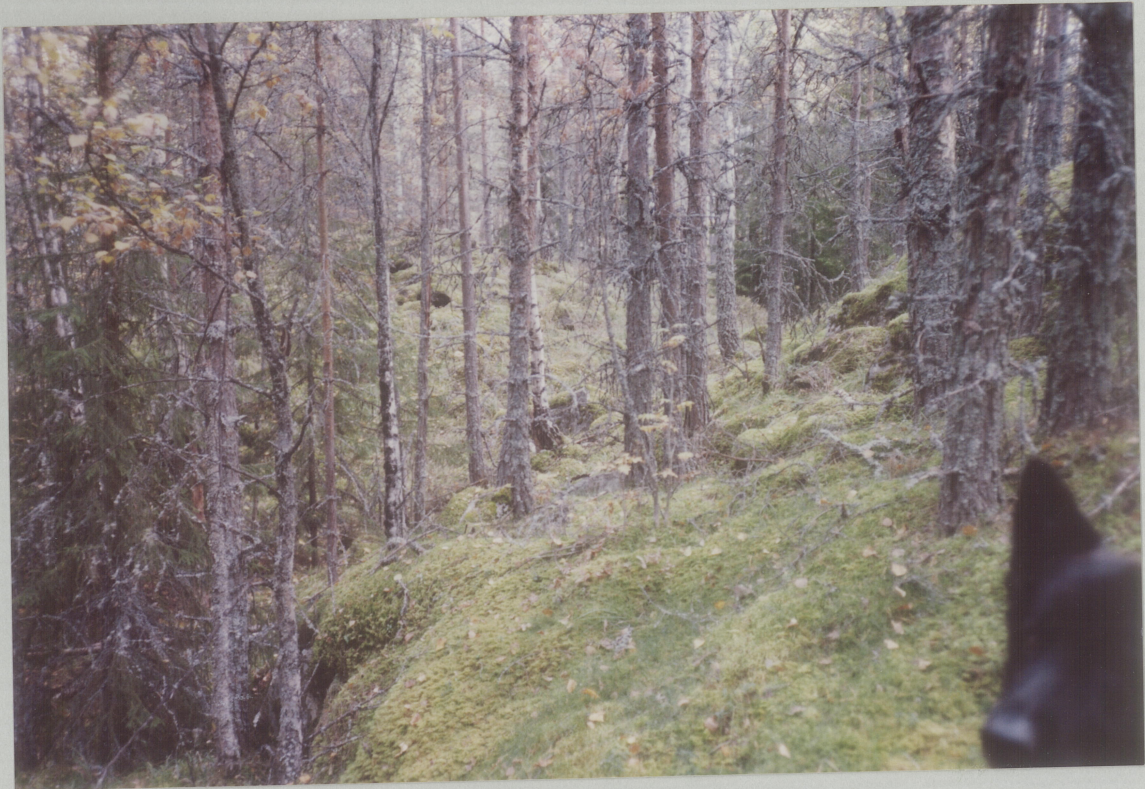
NR. 11. MOT SYDØST