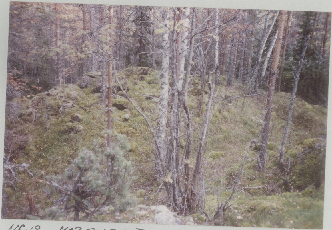
NR.13 MOT SYDPST