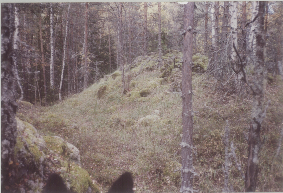
NR 5. TATT FRA BUNN AV SKRENT, OMTRENT RETT NEDENFOR NR 2,