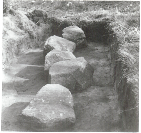
2: Detalj fotkjede, nord