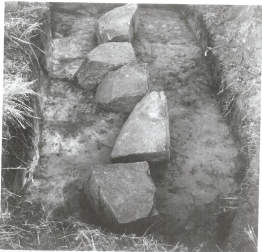
3: Detalj fotkjede, nord