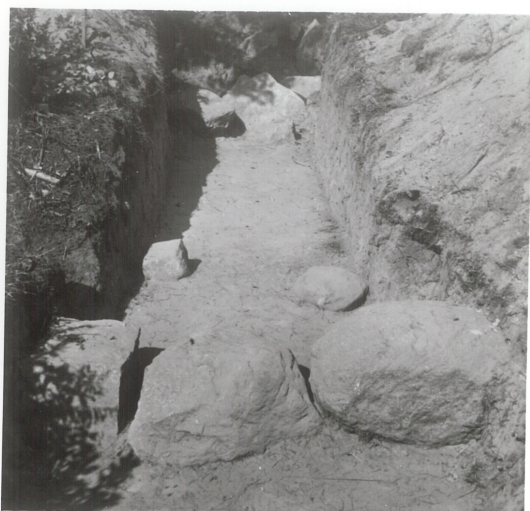
5: Detalj fotkjede, syd