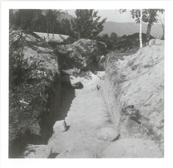
9: Detalj fotkjede, syd.