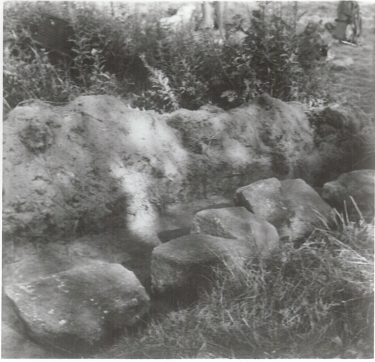
1: Detalj fotkjede, nord