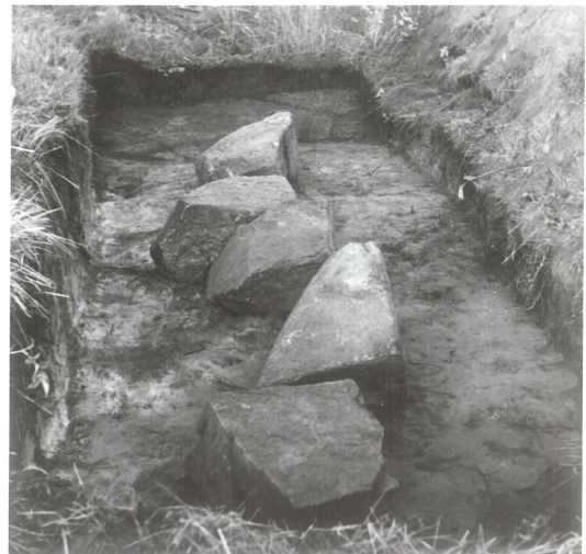
4: Detalj fotkjede, nord