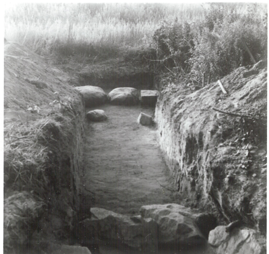
6: Detalj fotkjede, syd