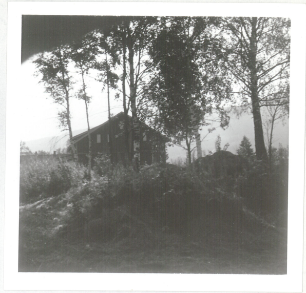
8: Gravhaug, låven Gran gård i bakgrunn.