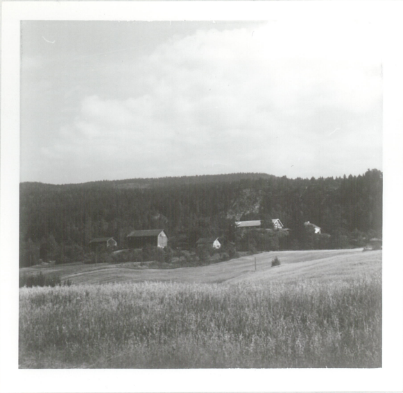
7: Bygdeborg i åsen, sett fra gravhaug.