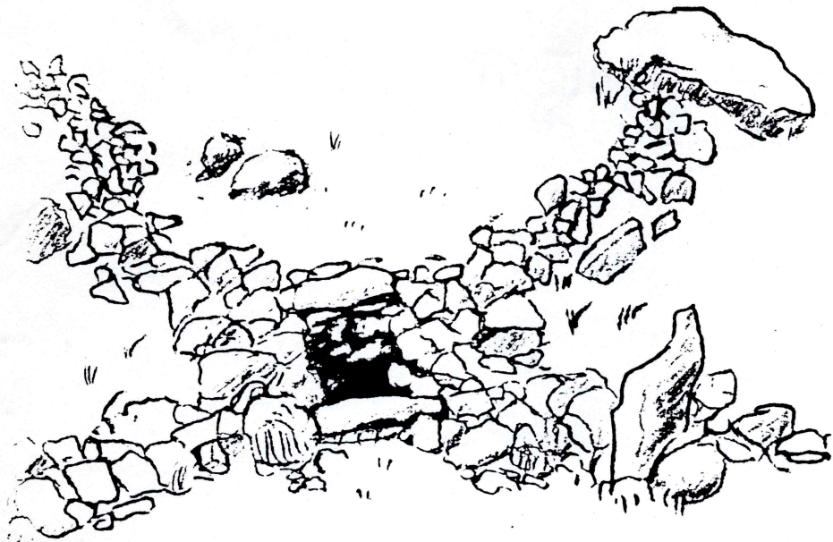
Dyregrau i Nördre Bottan.