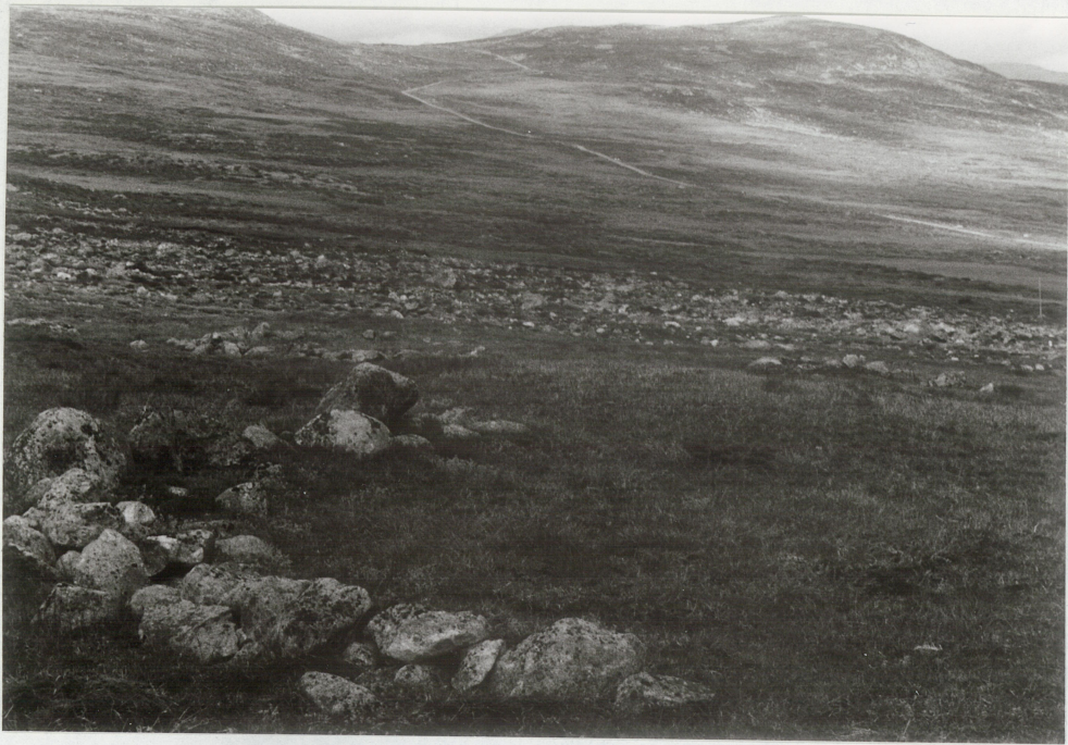
Lokalitetene fra ASA. Nr 3 i forgrunnen.