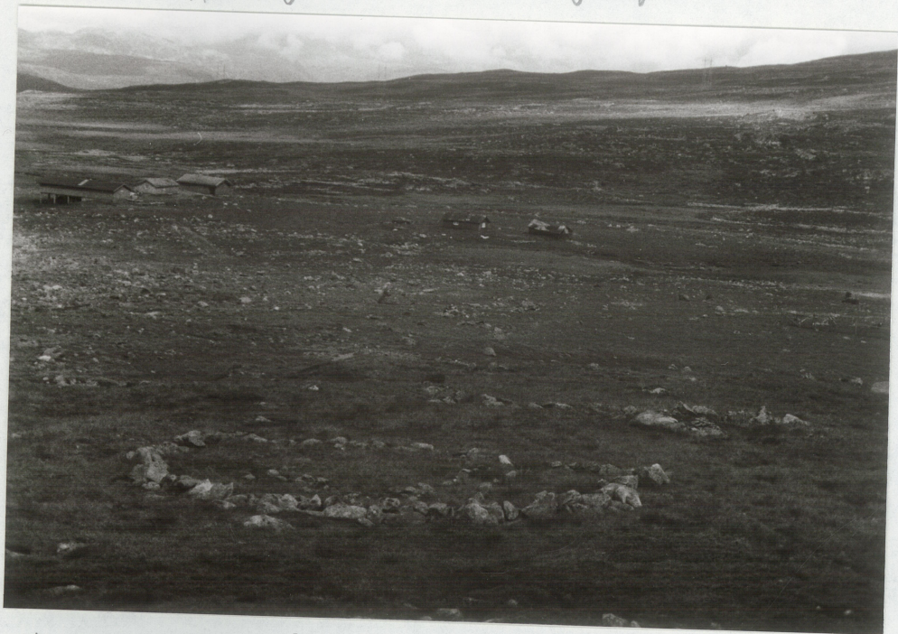
Nr. 2 og 1 sett fra S.