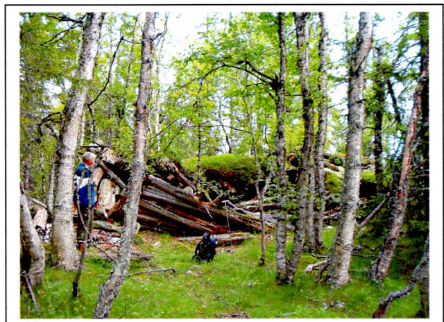
Figur 1: Årbu, Vesle seter.

Måler 8.00 m østvest og 4.20 m nordsør. Bygningens tak har rast sammen med deler av veggene, men de nederste stukkene ligger på sin plass. Steiner som fundament for den laftete bygningen. Bygningen er delt inn i 3 deler, fra vest 2 m inngangsparti, med påfølgende selve åren i 4.80 m lengde før mot øst en mindre del på 1.20 m i lengde GPS innmåling: 8 m avvik N 60 12.787 Ø 008 58.205