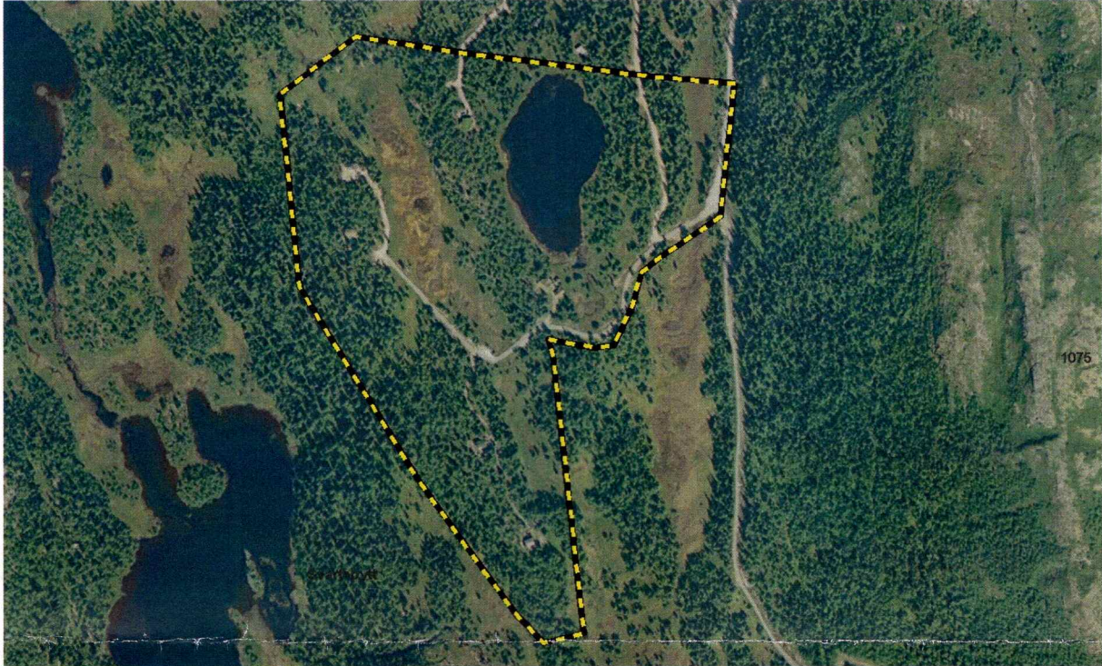
Ortofoto fra planområdet

I områder med størst potensial for forhistorisk aktivitet, ble det stukket systematisk med spade og sonderingsbor for å påvise eventuelle kull- eller kulturlag.