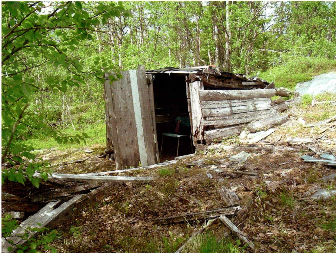
FOTO: Siste rest av saga på Sagodden.