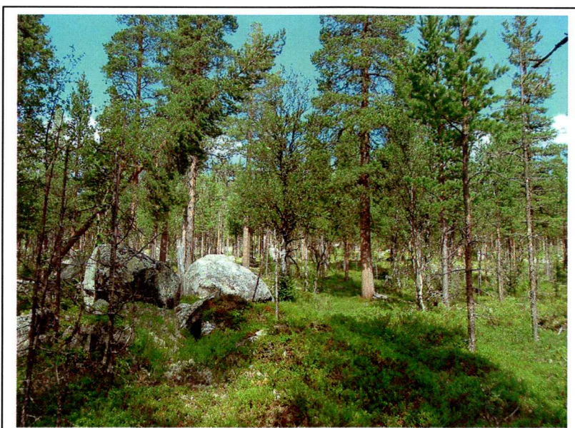
Foto: Nordre del av planområdet, mot nord.

Navnet Storstein beskriver området svært godt siden overflaten stort sett består av stor stein. Vegetasjonen er furuskog med innslag av kortvokst bjørk. Området avgrenses i nordøst og sør av vei.