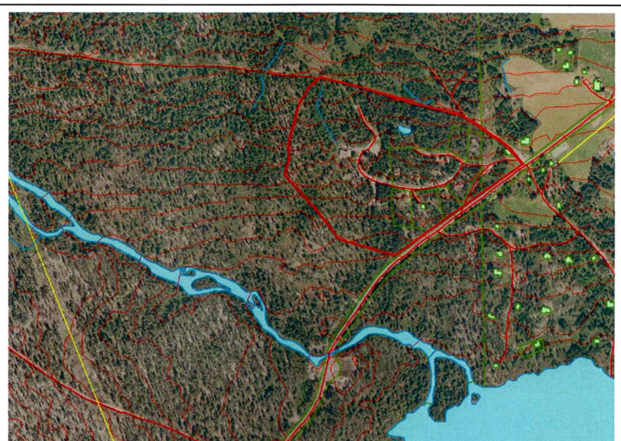
Satellitt bilde over området.