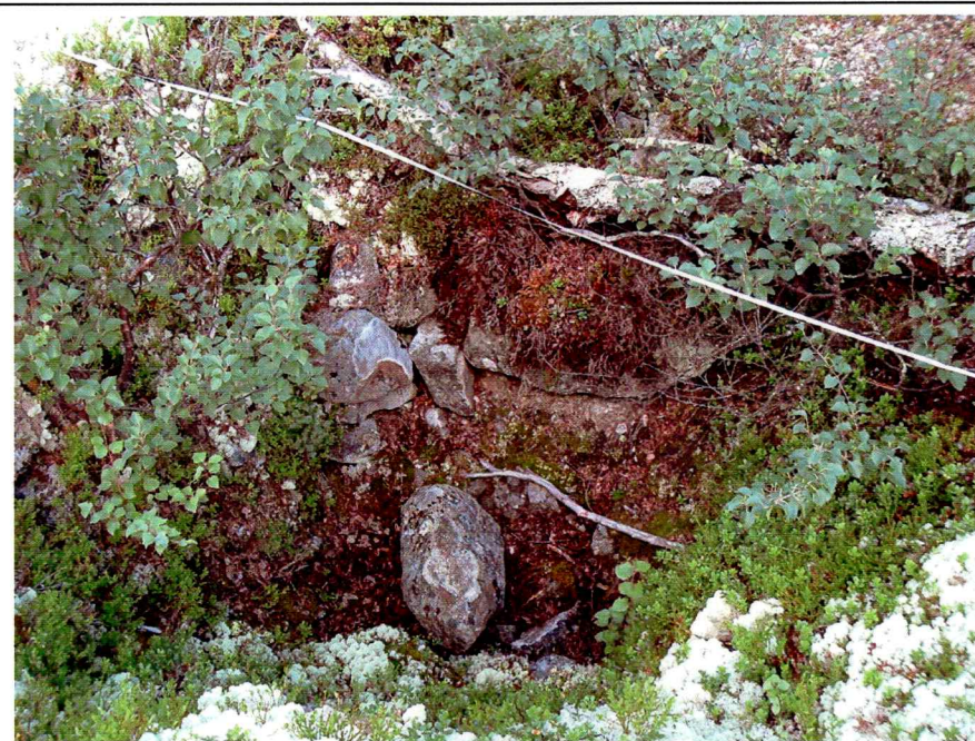
Foto: Bunnen i ID 100086-2. Sparkekassen synlig som mørkere parti.