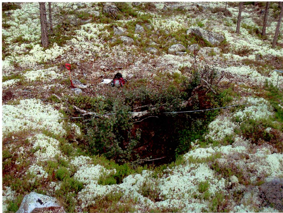
Foto: ID 100086-2 mot nord. Traktorspor synlig nord for fangstgropa.

Beskrivelse: Ligger i nordlig ende av blokkrik morenerygg. Tydelig sparkekasse i bunn, orientert øst-vest. Traktorsti har trolig fjernet vollen i nord.