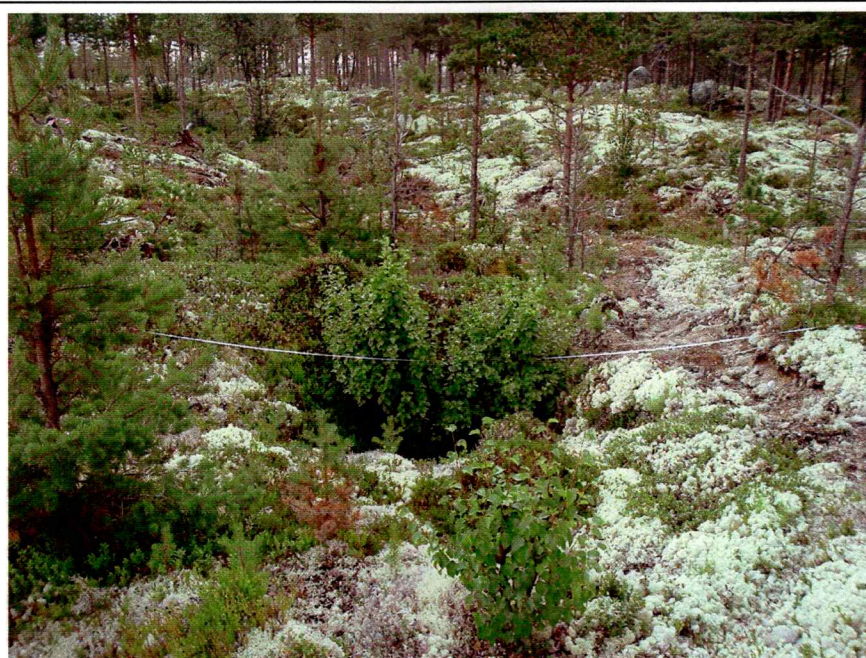
Foto: ID 100086-1 mot sør, traktorspor i vestlig kant synlig.