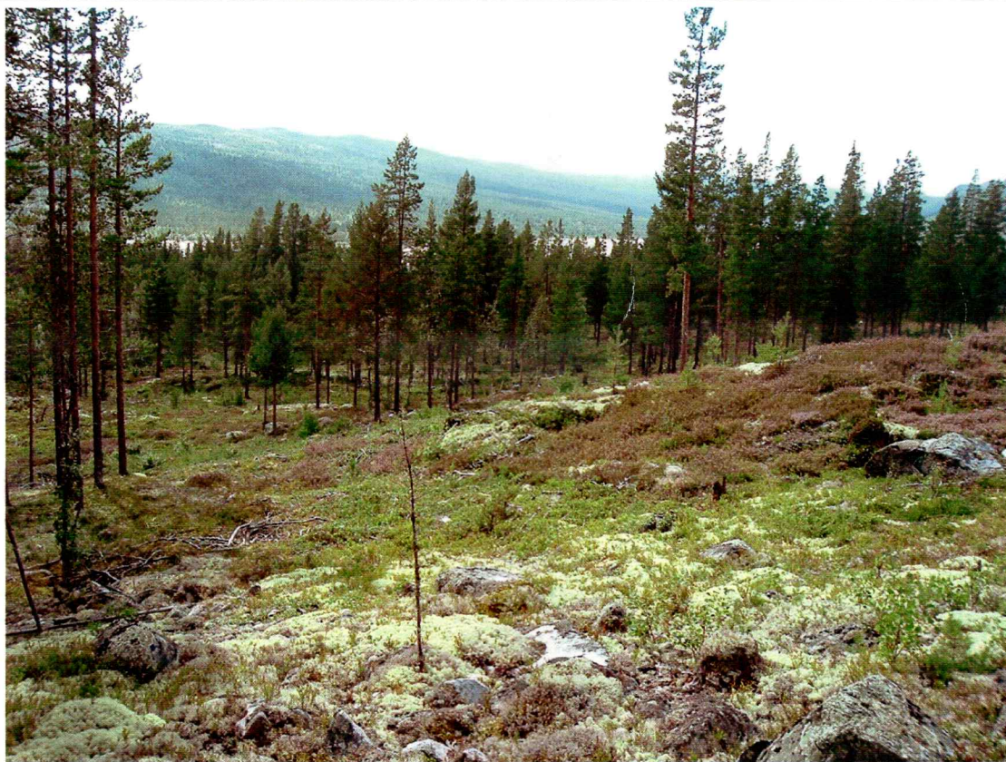
Foto: Oversikt over planområdet, topografi og vegetasjon, fra nordøst mot sørvest. ID100086-4 i midten av bildet.

Planområdet ligger på nordre side av Pålsbufjorden, sørøst for Grefsgardnatten og vest for Bjørnsrudbekken, og grenser mot Grefsgard i vest. Tidligere registreringer omfatter ID 9837 og ID 75200, 1 bogastelle og 2 fangstgroper.