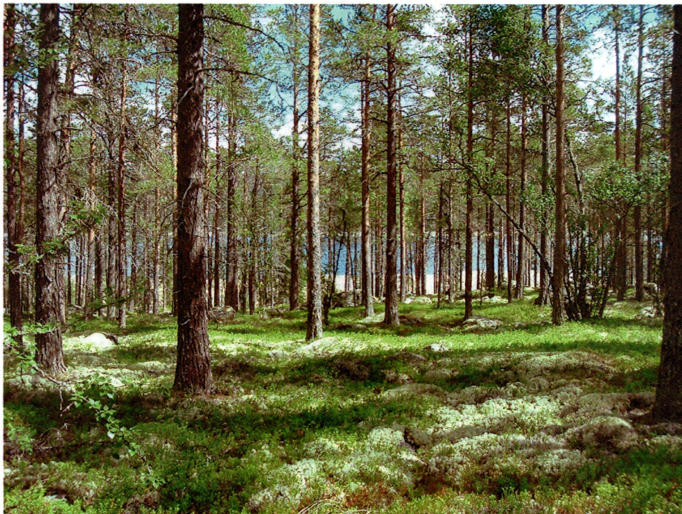
Foto: Sørøstlig del av planområdet, mot øst.