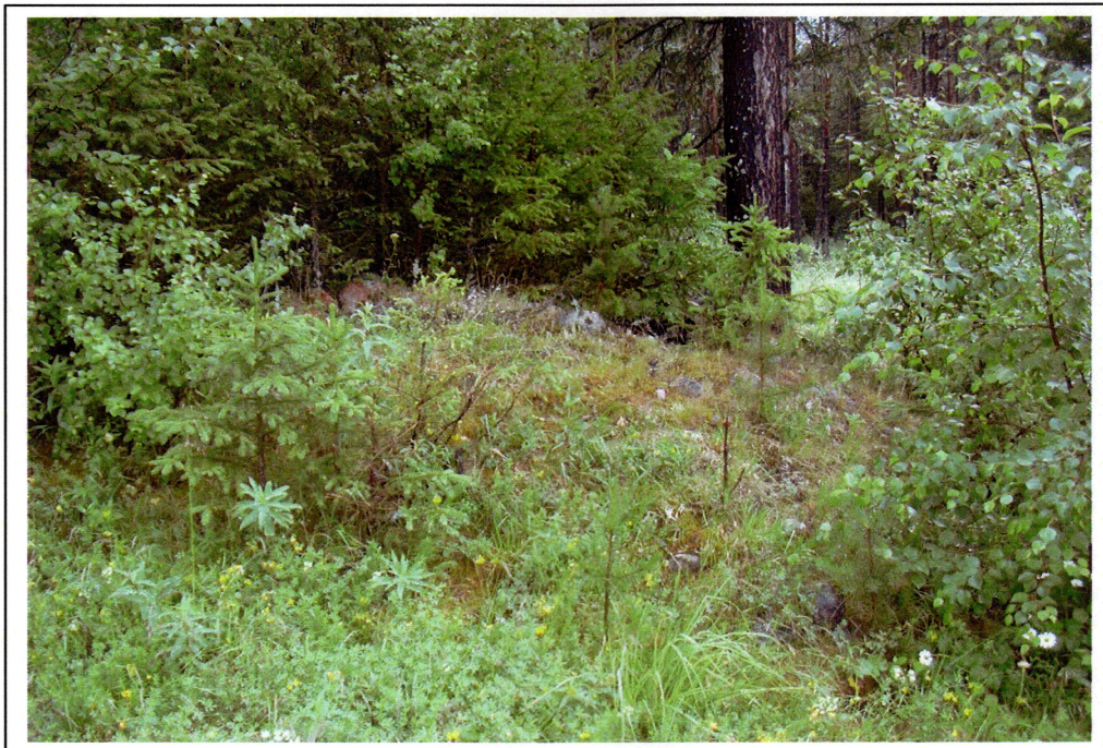
R1, gravhaug mot sør