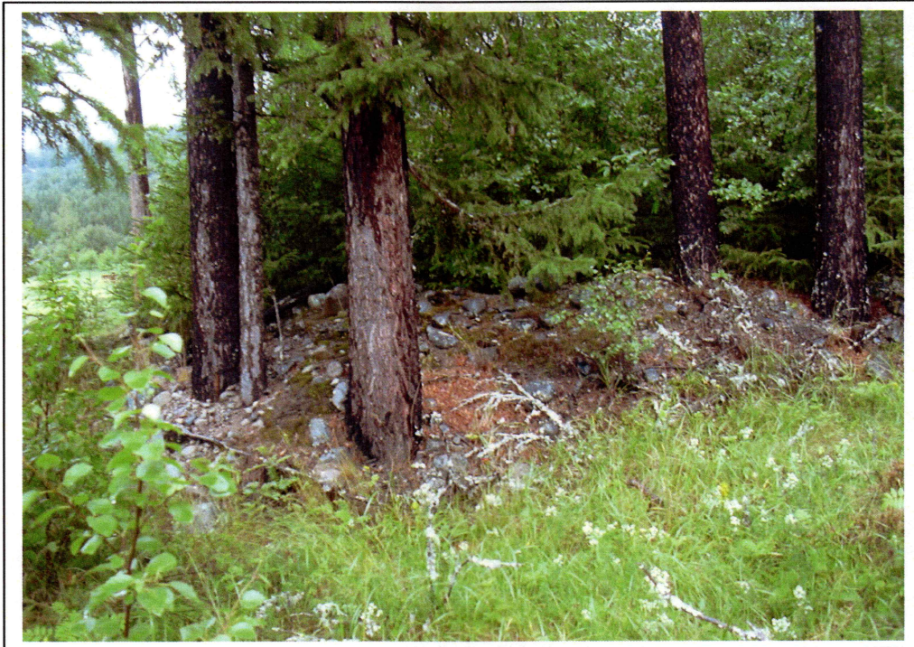
R1, gravhaug mot nordøst