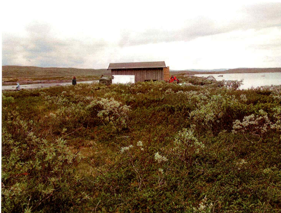
Befaringsområde ved Øvre Hein

Det omsøkte området ligger sørøst på vannet Øvre Hein. Området ligger i høyfjellsterreng på Hardangervidda nasjonalpark. Beliggenheten ligger over tregrensen der vegetasjonen domineres av gress, lyng mose, einer og vier. Kjølebua skal settes opp rett ved et eksisterende naust på indre del av et nes. Terrenget er småkupert, med mye stein i grunnen, myrdrag og enkelte tørrere partier.