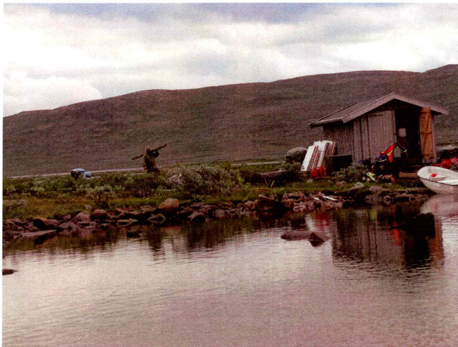
Undersøkesområdet på Øvre Hein

Som primær metode ble det stukket systematisk med spade for å påvise eventuelle kull- eller kulturlag og spor etter aktivitet tilbake til steinalderen. Det ble også undersøkt visuelt i området rundt naustet for eventuelle spor etter fortidig menneskelig aktivitet.