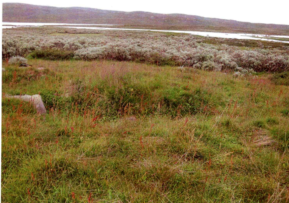
Gravhaug på Øvre Hein

og øst, noe utydelig i sør. Fotgrøften er dypere i nord og delvis i øst, dette kan skyldes husdyr som tidligere har beitet i området.