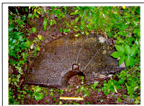
Figur 1: Kvernstein, fra X2 mølle.