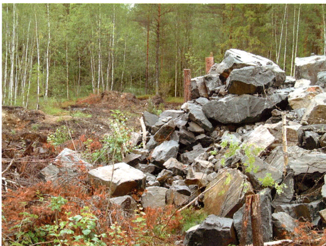
Østre del av gbnr 133/82 med området for nye tomter (133/11) i bakgrunnen (mot N)