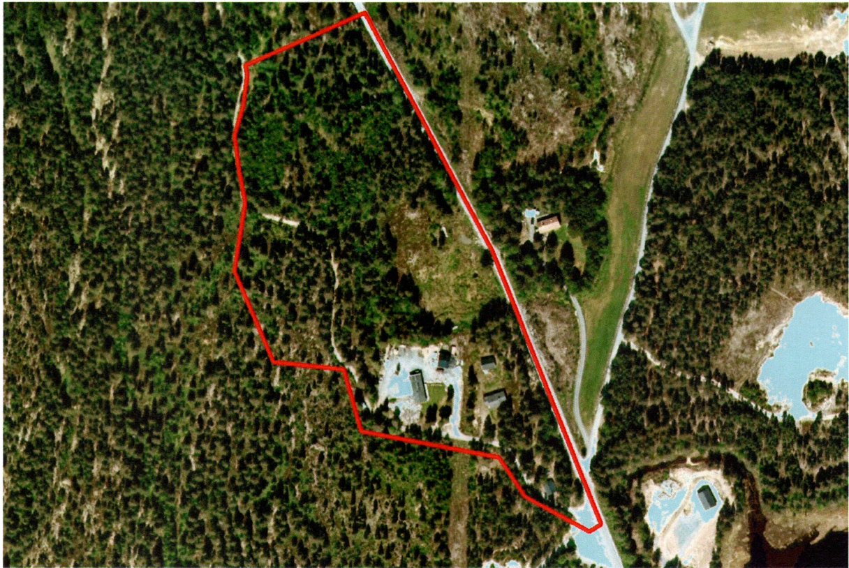
Satelittfoto over planområdet