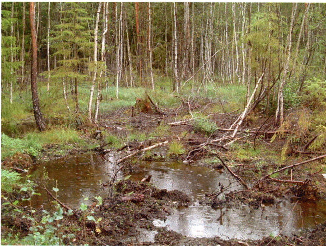
Våtmark i området for nye tomter på gbnr 133/11 (mot NV)