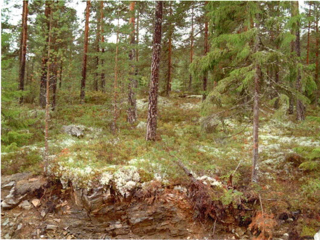
Skogvegetasjon i området for nye tomter på gbnr 133/11 (mot NV)