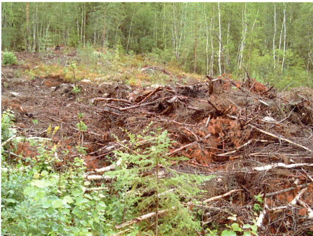
Ryddet og grøftet område med noe spredt kull på gbnr 133/82 (mot NV)