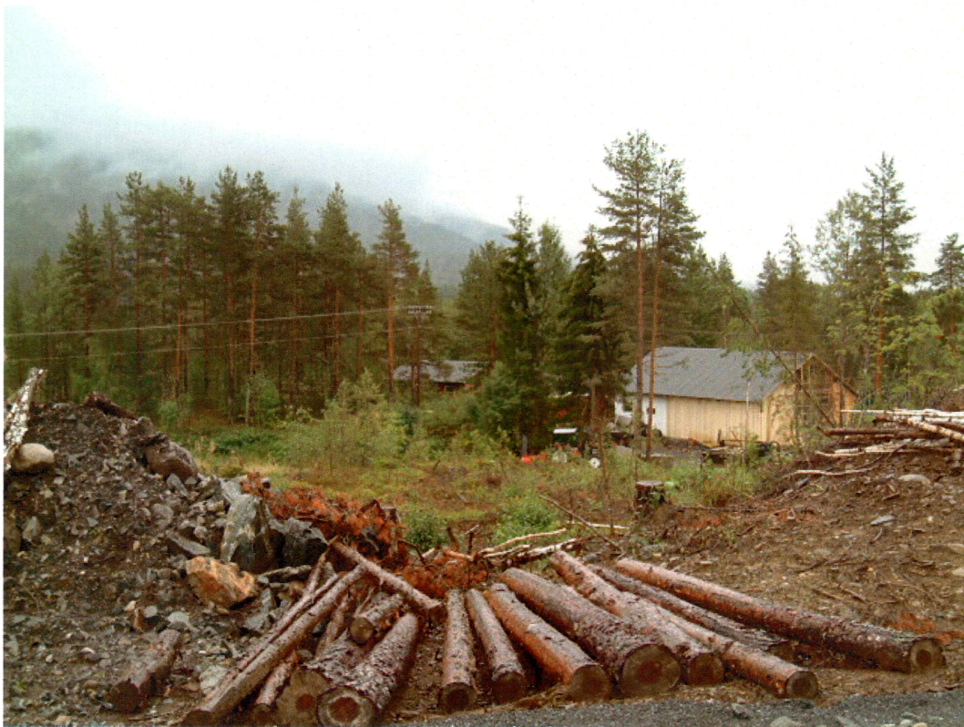
Utsikt over eksisterende tomter på Knausen (mot SØ)