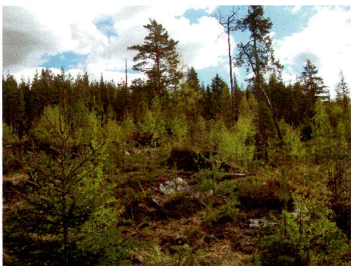
Bilde 1. Illustrerer terrenget i området med hogstflate og blokkmark.

Området for reguleringsplanen er anslagsvis på 160 mål. Det undersøkte planområdet var òg blitt ryddet for en del vegetasjon i form av hogst/uttyning av skog. Det er ikke registrert automatisk fredete kulturminner i planområdets umiddelbare nærhet og et søk på gårdsnavnet Lampeland i databasen for gårdshistorie og gårdsnavn viser at gården Lampeland (gnr 111) ble nyryddet i 1668. Navnet kommer da antageligvis av elva som den gården ligger ved.