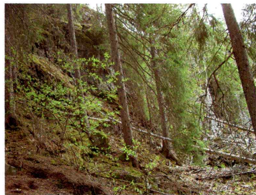
Bilde 2. Viser den nederste delen av ei ur som går i planområdets nederste del.