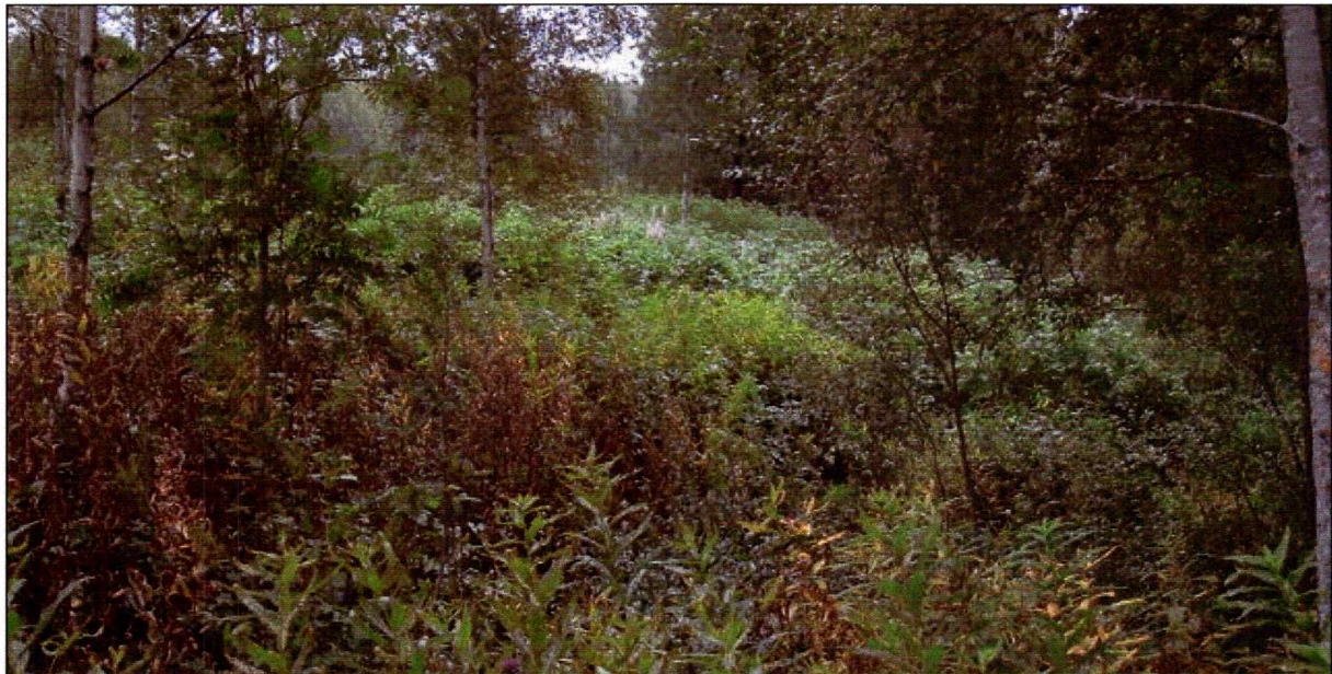
Eksempel på kratt og tett vegetasjon.

Planområdet ligger mellom jordbruksarealet til Bekkejorden i nord og øst, jordbruksareal tilhørende Lyngjorda i vest og Fylkesvei 63 med jordbruksareal og Lyngdal kirke i sør. Ut fra plasseringen av rydningsrøysene, som ligger i utkant av eksisterende jorder, ser det ut til at planområdet har vært et randområde med hensyn til jordbruk. I dag er nesten hele området tilvokst med kratt og tett vegetasjon.