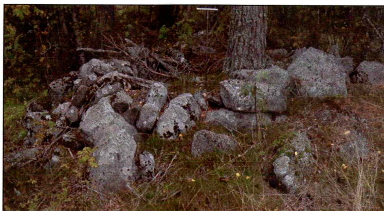
Eksempel på røys.