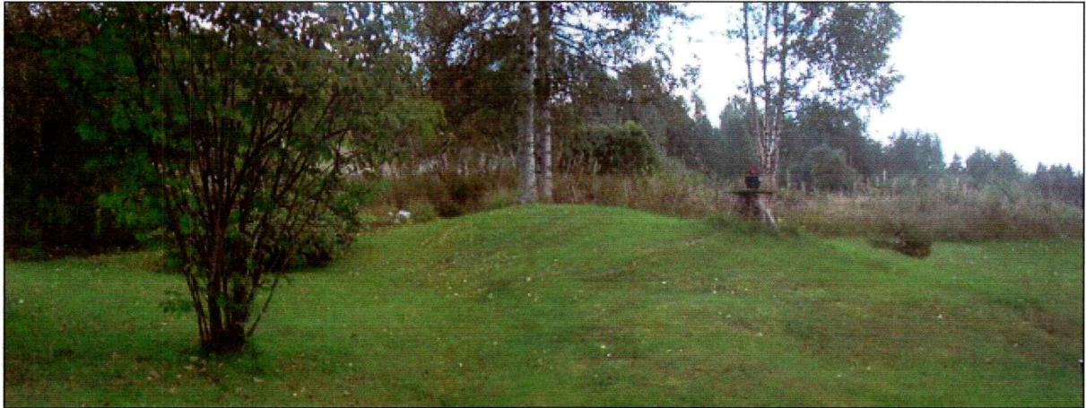
Haug av ukjent funksjon.

eksisterende jorder, at de er oppbygd av større stein (et resultat av bruk av traktor for rydding av stein), og at de i liten grad er tilgrodd (struktur 1, 3-10 og 12-22). Det ble også registrert en haug med ukjent funksjon, og som antagelig er natur (struktur 2) og en brønn (struktur 11). Røysene er stort sett intakt, med unntak av struktur 1 som er delt i to. Videre vil jeg bruke litt tid til å beskrive struktur 2, som er en liten forhøyning på en morenerygg. Denne er antagelig natur, men bør kanskje undersøkes nærmere. Siden denne lå inne i en hage ble det ikke gravd i den. Haugen er sirkulær, 4 m i diameter og 0.5 m høy. Når morenhaugen ble undersøkt viste den seg å inneholde grus, mens toppen bestod av stein/heller som lagde en hul klang ved jordborstikking. Enten er dette natur eller så bør den ses i sammenheng med en betongbygd brønn eller undergrunnsbygning 2 m lengre øst.