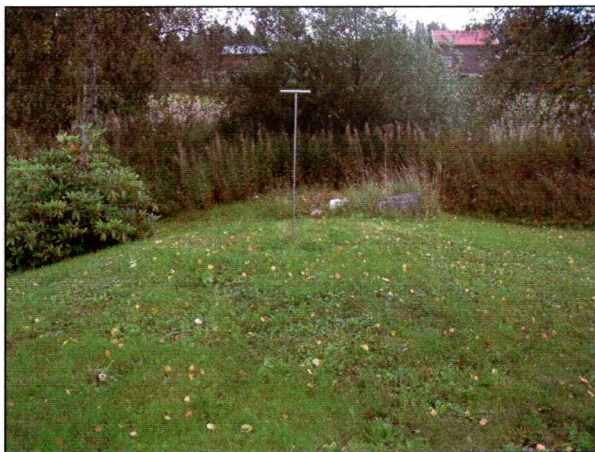
Detaljebilde av haugen.