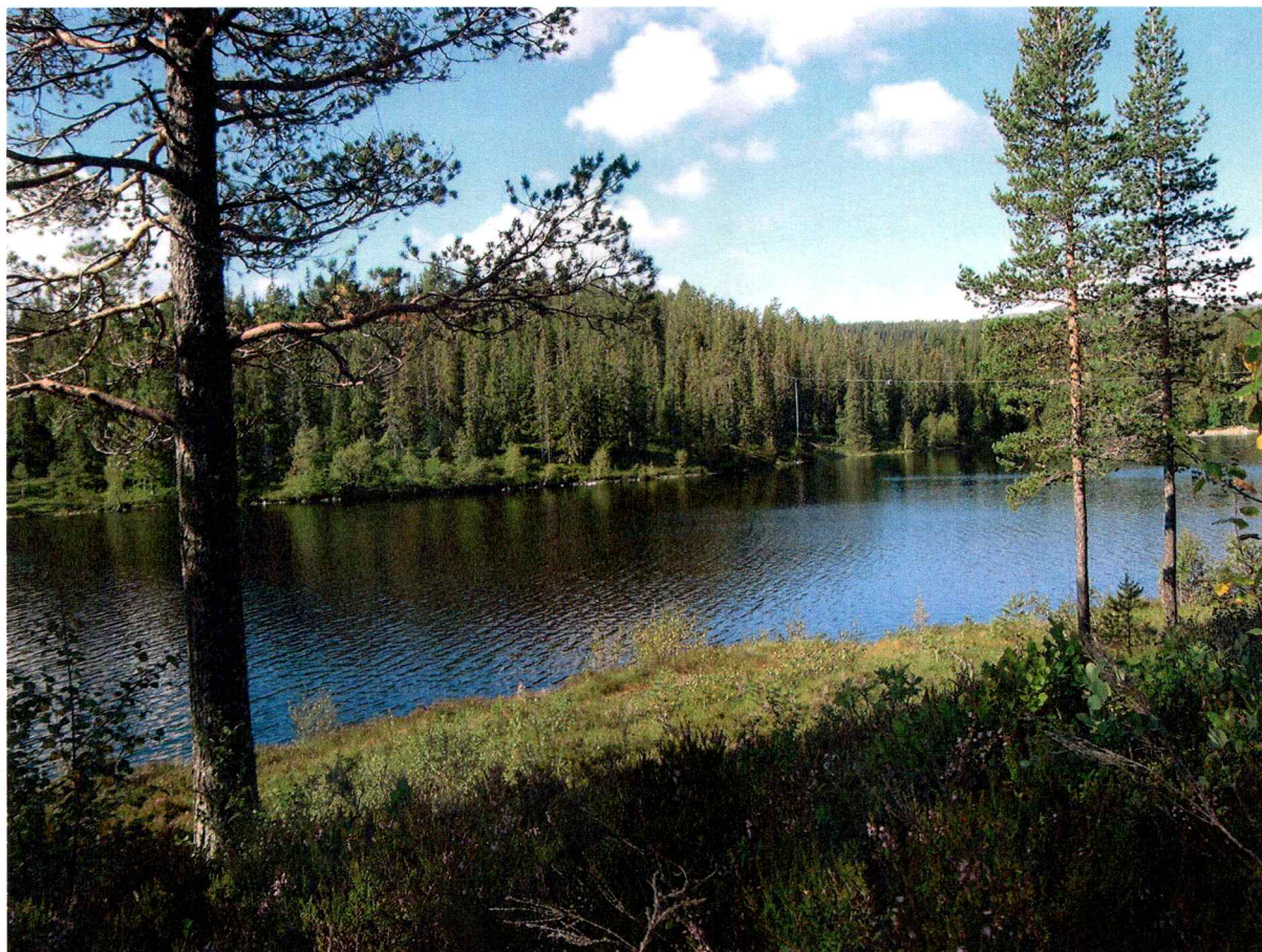
Søre Solum og Holmevatnet

Det er varslet oppstart av reguleringsplan på et område ved Søre Solum (gnr. 9, b.nr. 8) i Flesberg kommune, tiltakshaver er ar plan & landskap.