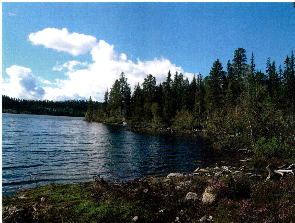
Langs Holmevatnet på Søre Solum

Kulturminner som vi i utgangspunktet kunne forvente å finne i et slikt område, som fangstgraver, jernproduksjonsanlegg, boplasser og graver, fantes ikke. Det er mye berg i området som ligger grunt eller åpent i dagen, det er slikt sett vanskelig å ha noen form for nedgravning, som for eksempel kullmiler og fangstgroper. De aller fleste av myrene er ikke jernholdige slik at mulighetene for jernproduksjon i området er liten. Siden Holmevatnet er regulert ble det ikke tatt noen større undersøkelse etter steinalderlokaliteter langs vannet.