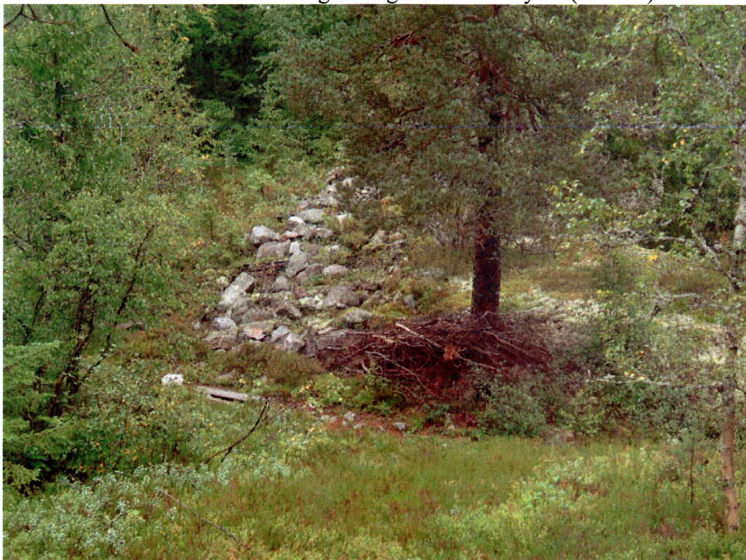
Demning ved Ramnesskarjuvet (mot N)