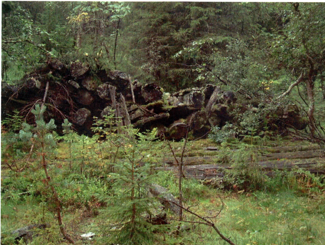
Tømmerstabel ved tuft 1, Annebu (mot S)