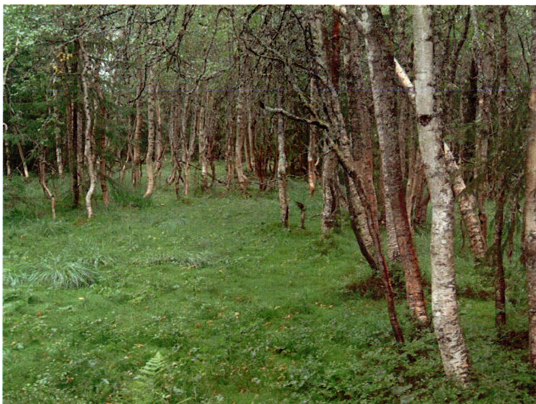
Slåttelandskap ved Annebu (mot NØ)