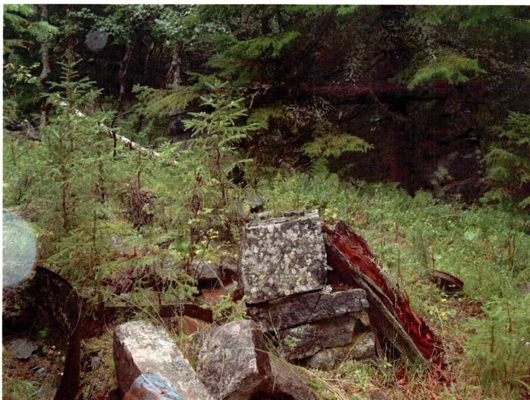
Syllsteiner med syllstokk i bakgrunnen, tuft 1, Annebu (mot VNV)