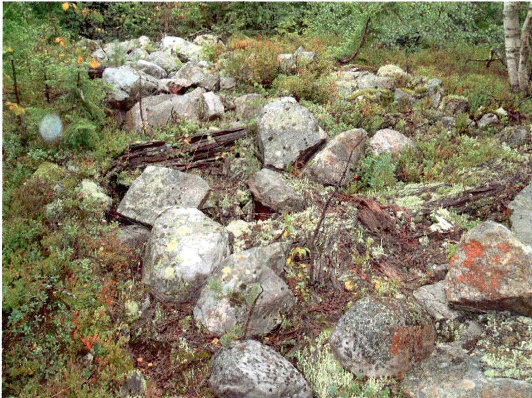
Demning ved Ramnesskarjuvet (mot N)