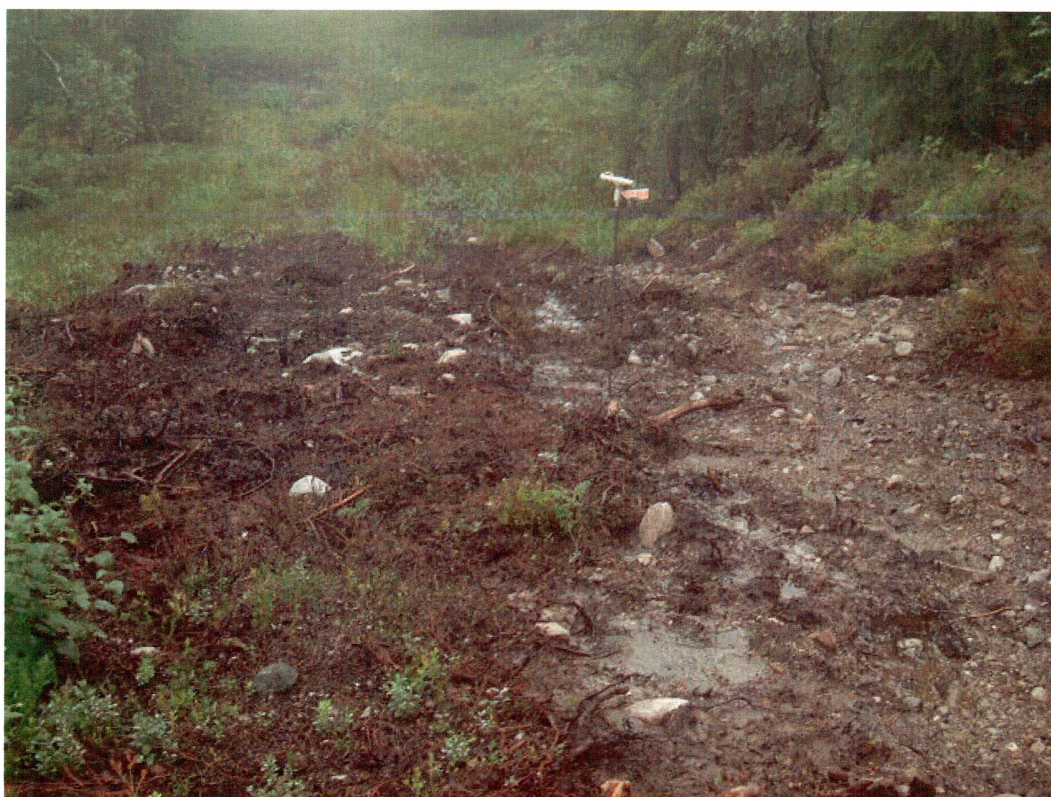
Skogsvei med kull i dagen, lokalitet 3 (mot SV)