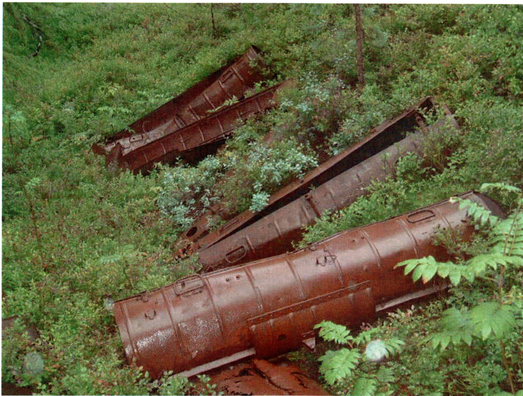
Rustne beholdere fra krigens dager ved Krokmyran (mot SV)