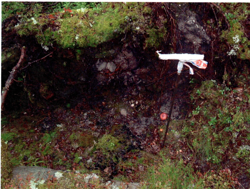
Rotvelt med påvist kull ved Ramnesskarjuvet, lokalitet 3 (mot Ø)