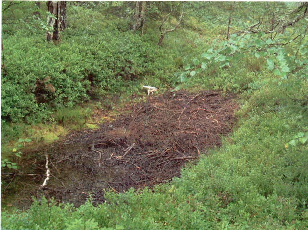
Grop ved Annebumyrn (mot SØ)