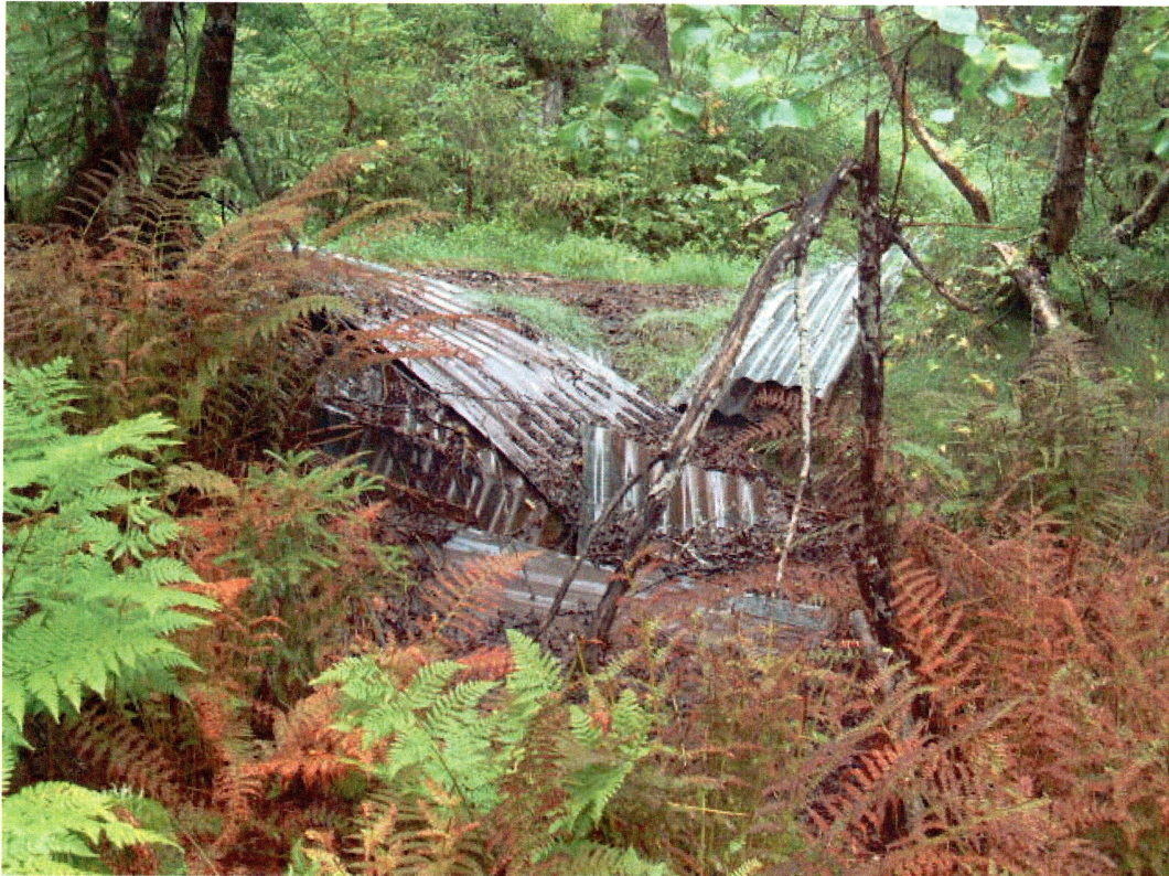
Spredt bølgeblikk, tuft 2, Annebu (mot SV)