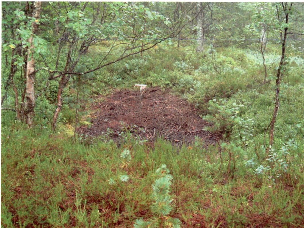
Grop ved Annebumyran (mot S)