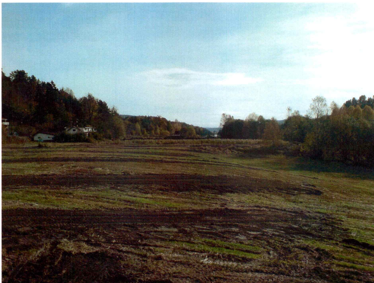
Planområdet etter sjakting. Bilde tatt mot Ø.