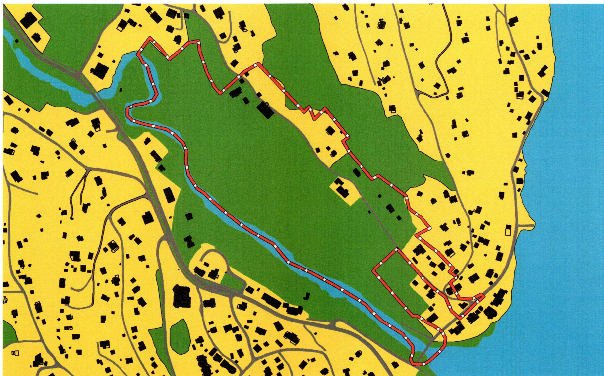
Planområdet på Store Åros