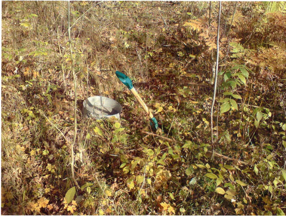
Eksempel på flate der det ble prøvestukket.