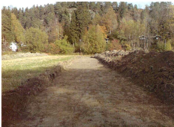
Eksempel på en av sjaktene som ble åpnet på Store Åros. Bildet er tatt mot N.