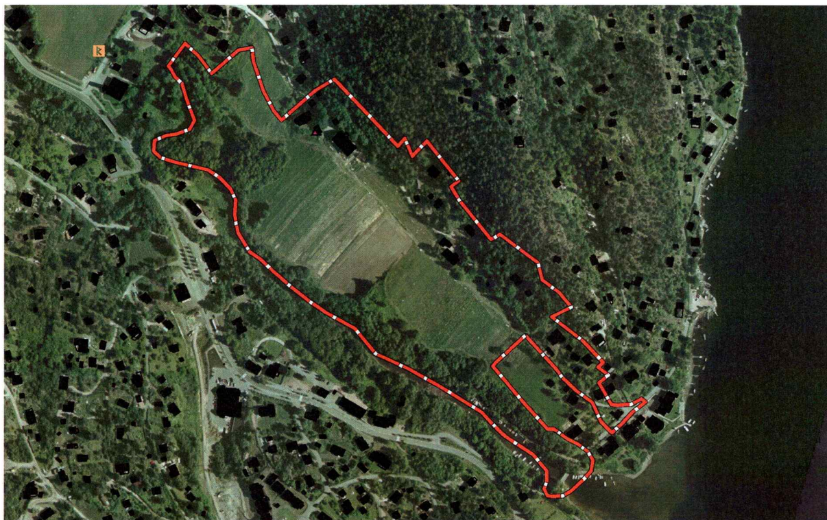
Ortofoto over planområdet.

Planområdet ligger langs og like nord for Åroselven. Området består hovedsakelig av dyrket mark, noe kratt områder langs elven og noe skogsområder langs jordene i nordlig del. Høyden over havet varierer i området med ca. 10 meter. Fra ca. 20 moh. Langs elven til ca. 30 moh. I skogsområdene. Nord- Vest i planområdet ligger en gård og et gårdstun, mens det i Sør- Øst er boligbebyggelse. I den skogkledde delen av planområdet ligger noen hytter spredt fra NV til SØ. Det går en gårdsvei fra NV gjennom gårdstunet og ned til boligbebyggelsen i SØ.