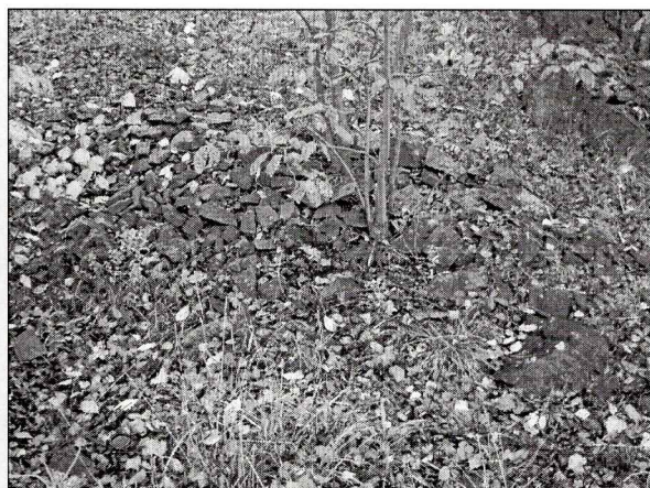
Sørlig del av planområdet/berg- og steinflater.