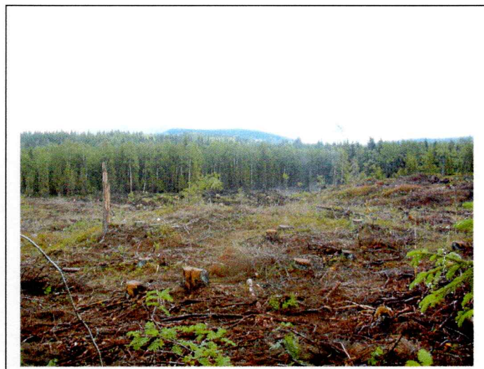
område sett mot øst