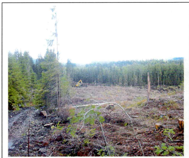
Område sett mot nordøst

Området fremstår som en svakt hellende skråning som faller av mot øst. Noe fjell i Dagen. Området som helhet var hogd ut og stedvis ferdig ryddet. Området er avgrenset av myr i øst, skog i nord og eksisterende åker i vest og syd.