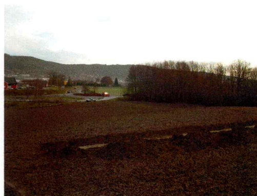
Bilde 2. Viser en nord-sør gående sjakt.