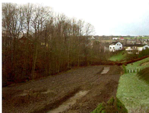
Bilde 1. Viser tre øst-vest gående sjakter.

Sjaktingen av planområdet ble utført med en Kabelco gravemaskin på ca 15 tonn. Maskinen hadde en grabb med flatt skjær, og bredden til skjæret var på 1,5 meter. Strategien bak sjaktene ble å ta de øverste høyereliggende områdene først, siden dette området ble vurdert dit hen med høyest potensial for funn. I alt ble 22 søkesjakter lagt ut. Bredden til disse er omtrentlig 3 meter og lengden varierer fra 25 til 35 meter. Et grovt overslag tilsier at det totale flatavdekkete området tilsvarer omtrentlig 2 mål. 19 av sjaktene har en nord sørgående retning, mens 3 av sjaktene er lagt fra vest mot øst (kart 2). Avstanden mellom sjaktene ble satt til omtrentlig 12 meter. Matjordlaget i området varierer fra 35 til 40 cm. Undergrunnen i området består av en lys leirmasse. Moderne forstyrrelse kunne ikke spores i undergrunnen, bortsett fra pløyespor, noen få grøfter framsto massene som urørte. Lengst mot øst i planområdet var området mer forstyrret i forbindelse med kabelarbeid og arbeid i forbindelse med veibygging. Alt i alt framstår området som lite forstyrret av mennesker i moderne tid.