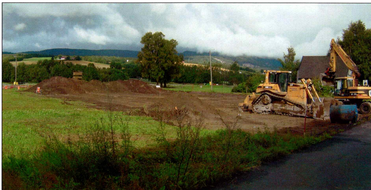
Utplanert parti av planområdet.

Undersøkelsesområdet bestod i en gresslette mellom næringsområdet Lille Valle i øst og en rideskole i vest. Sletten er flat i nord og heller nedover fra senter av området mot sør. Nevnt innledningsvis så var den nordlige delen av planområdet utplanert, mens resterende del av området var intakt med gressdekket overflate.