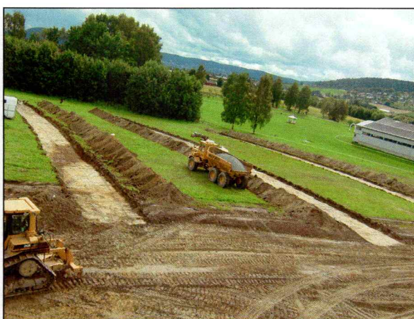
Sørlig del av sjakt 1, samt sjakt 2 og 3.