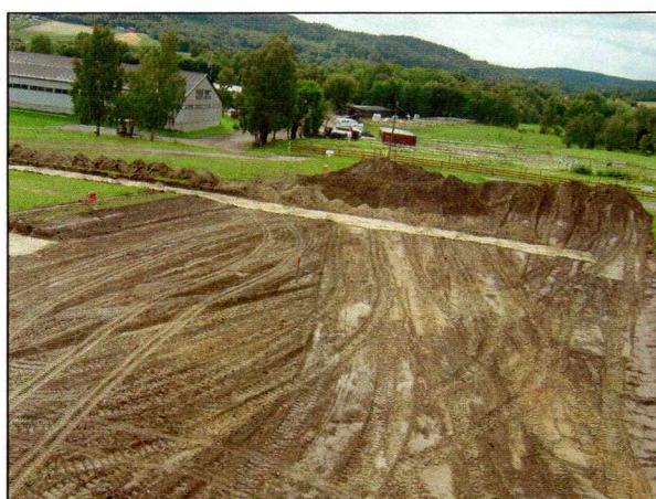
Nordlig del av sjakt 2.

Deretter ble det satt tre sjakter på henholdsvis 92 x 4 (sjakt 1), 66 x 4 (sjakt 2) og 61 x 4 m (sjakt 3) fra det omrotede området i nord og i sørvestlig retning. Totalt ble det dermed avdekket 876 m 2 . Det ble ikke avdekket noen form for artefakter eller strukturer i disse sjaktene. Et gammelt dyrkningslag ble avdekket i nordlig og sørlig ende av sjakt 3, men nyere tids keramikk i nedre del av dette tilsier at det er av nyere dato.