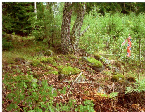
Bilde 4. Viser rydningsrøys 99951