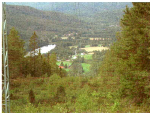
Bilde1. Viser terrenget ned mot Bevergrenda.

Vegetasjonen i området varierer fra kornåkre, beitemark, lauvskog, granskog furumoer og myrområder og krattskog. Topografien varierer omtrentlig like mye med slakere områder fra Flesaker og opp mot Darbu. Etter kryssingen av RV 134 blir terrenget mer kupèrt og siste biten fra veien mot Lurdalen og ned mot Bevergrenda er tiltider preget av bratt og ulent terreng (kart 1).