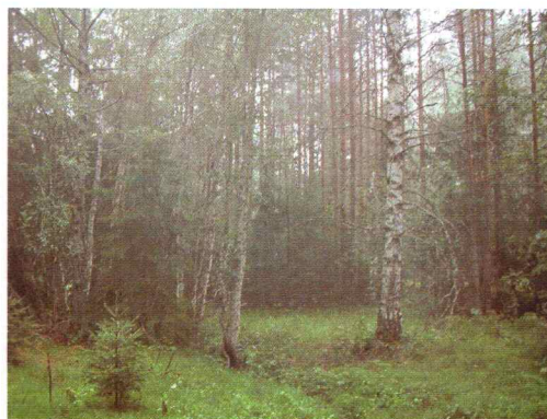
Bilde 2. Illustrerer skogsområdene nord for Darbu.

Da den tiltenkte trasèen strekker seg over flere gårds og bruksnumre i to kommuner vil ikke en gårdshistorie over dem enkelte gårder bli gitt her.