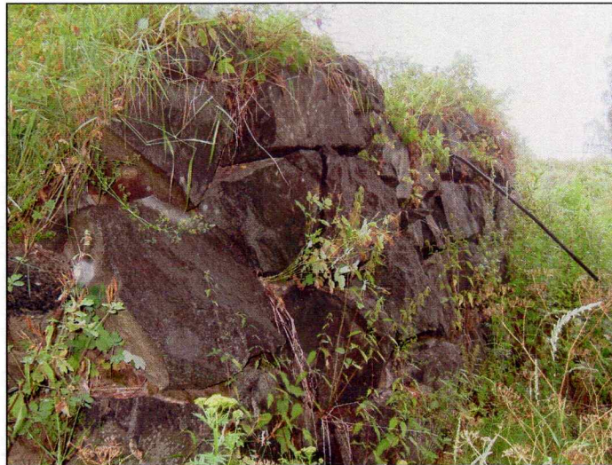
Steinmur ved Honelva (bilde tatt mot øst).

Ved elven ble det registrert en mur oppbygd mellom gårdstunet og Honselven, denne ser ut til å være bygd for å lage til en dyrkningsterrasse eller for å utvide landområdet (på oversiktskartet er dette merket område nr 4). Dateringen kan kanskje settes i sammenheng med etableringen av gårdstunet, som antagelig er fra 16.-1700 tallet (se omtale under sjakt 2).