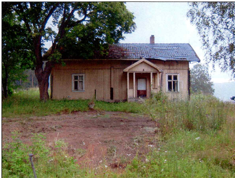
Hovedbygning med deler av gårdstunet.

Planområdet består av gressdekkede småpartier og gårdstun sørøst for Hon øvre, samt svært hellende terreng sørover mot Honselva. Det høyereliggende partiet bestod her av utplanerte partier med volleyballbane og fotballslette i vest og det gamle gårdstunet med tilhørende gressdekket areal i øst.