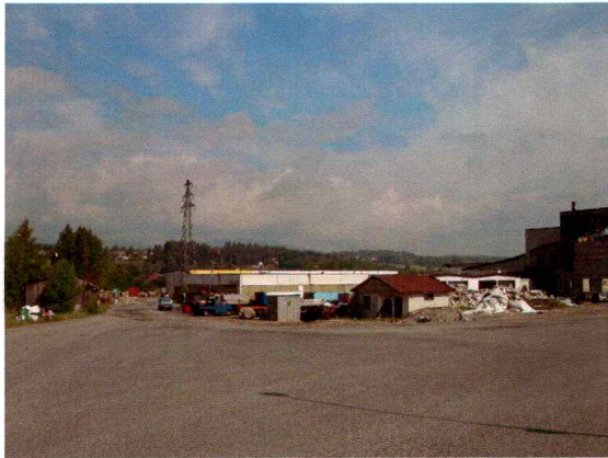
Bilde 1. Illustrerer sentrale deler av Ytong Industriområde med eksisterende bebyggelse.