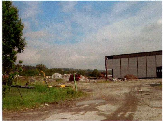
Bilde 2. Illustrerer Ytong Industriområde vestlige del med dagens bebyggelse/moderne inngrep.

Et søk i databasen for gårdshistorie/gårdsnavn kastet ikke mer lys over eventuelle gamle gårder og lignende som kunne ha eksistert på plassen forut for dagens industriområde.