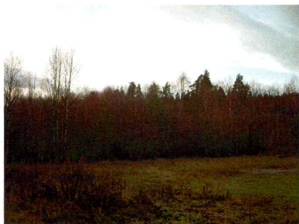
Bilde 4. Nordøstre delen av flata for prøvestikk.

Gjennomgangen av planområdet medførte ikke funn av automatisk fredete kulturminner. Både den visuelle overflateregistreringen og prøvestikkingen etter steinalderlokaliteter ved var negativ. Det kunne heller ikke spores eldre dyrkningsspor inne på området.