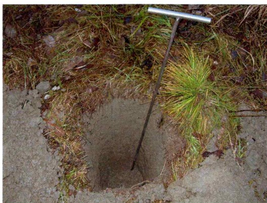
Bilde 3. Viser prøvestikk 1 og den lysgrå uniforme sandmassen.

Grunnforholdene her besto av en lysgrå og helt uniform sandmasse som framsto som mulig påfylt masse (bilde 3). Prøvestikkene var mellom 50 og 70 cm dype, uten å komme igjennom dette laget. Det kunne ikke påvises noen spor etter tidligere aktivitet i dette laget heller.