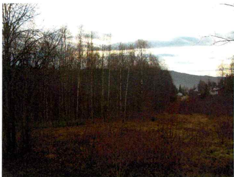
Bilde 1. Viser planområdets nordvestre hjørne.