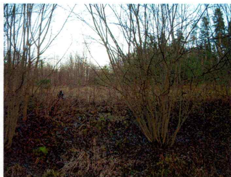
Bilde 2. Viser flata område for prøvestikk midt i planområdet.