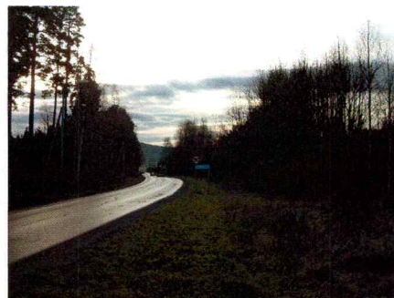
Bilde 5. Planområdets østre side mot Myrullveien.