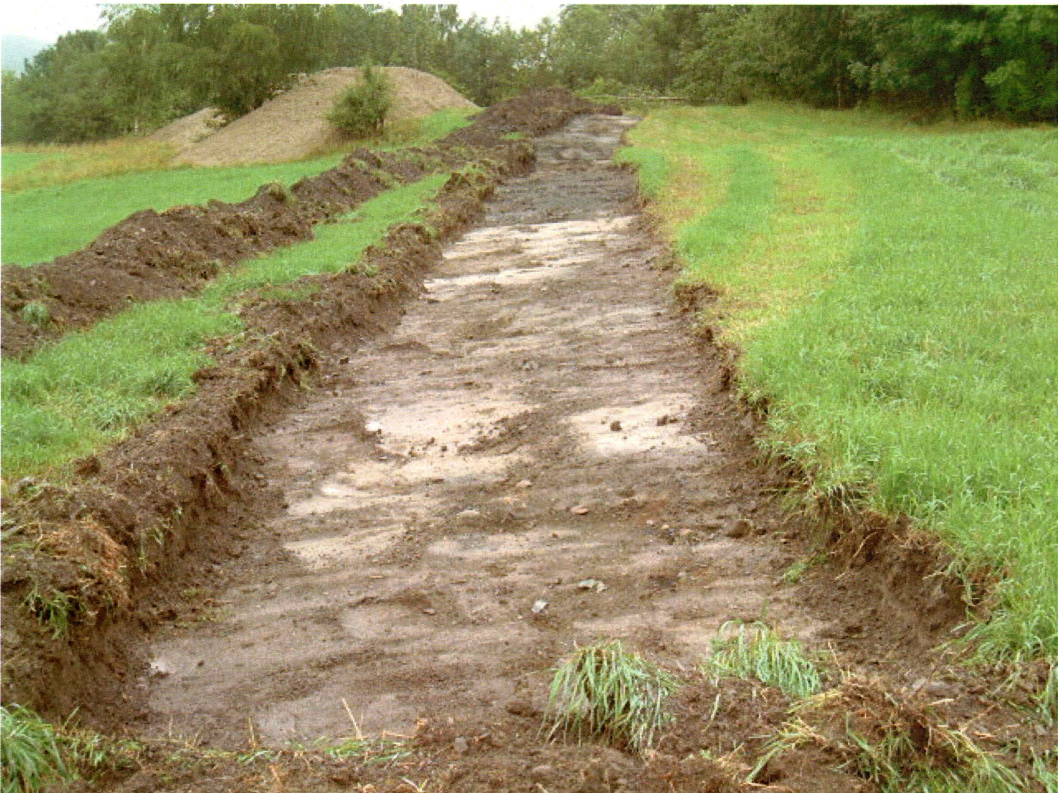
Sjakt 1 (mot NNØ)