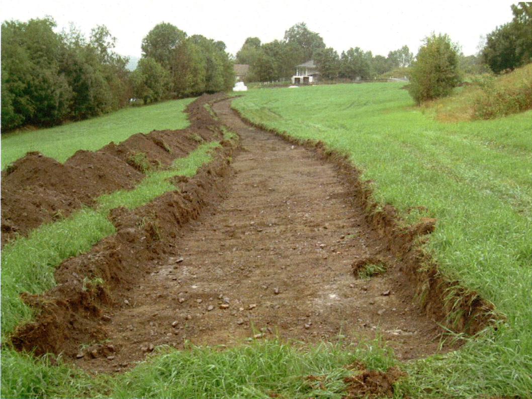
Sjakt 5 (mot N)