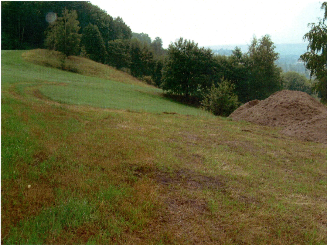
Oversikt over planområdet sett fra hull nummer 1 (mot SSV)