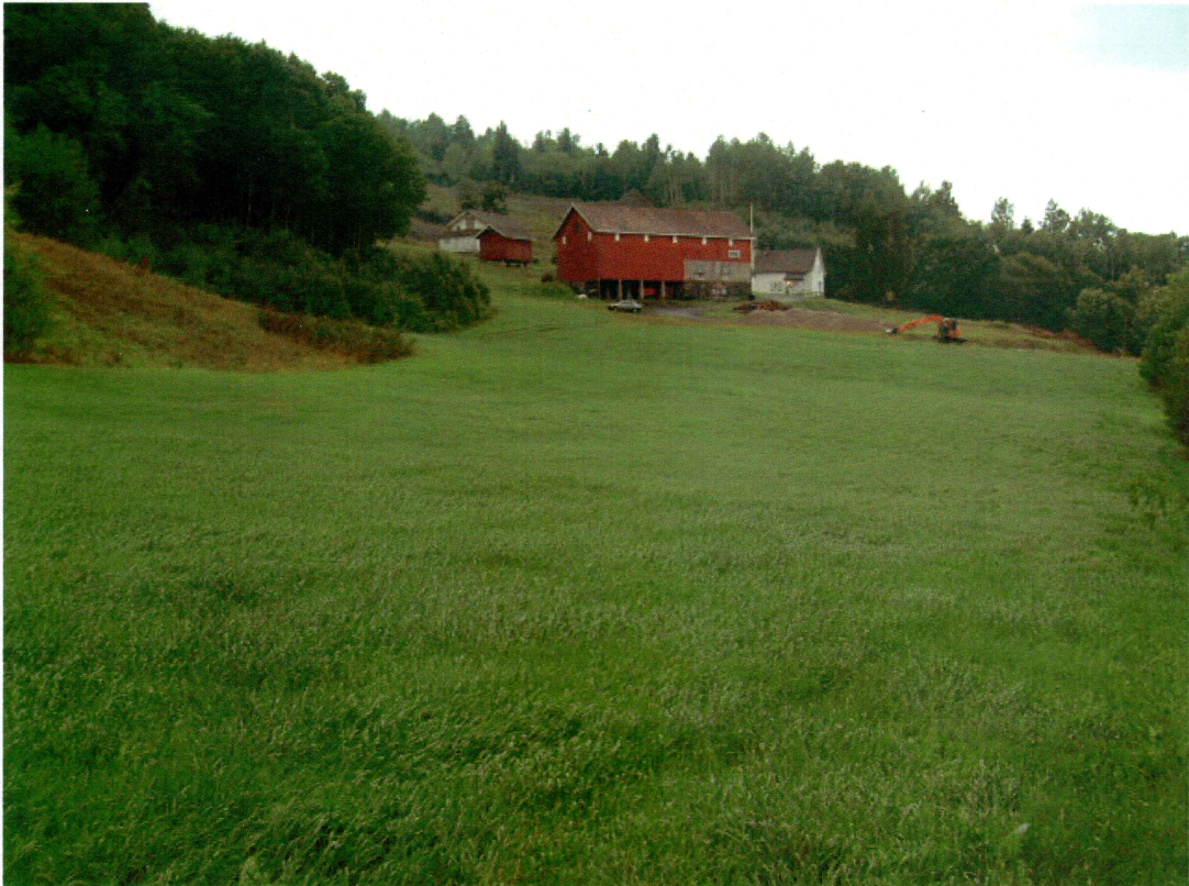
Oversikt over planområdet med gården Hval (21/1) i bakgrunnen (mot S)