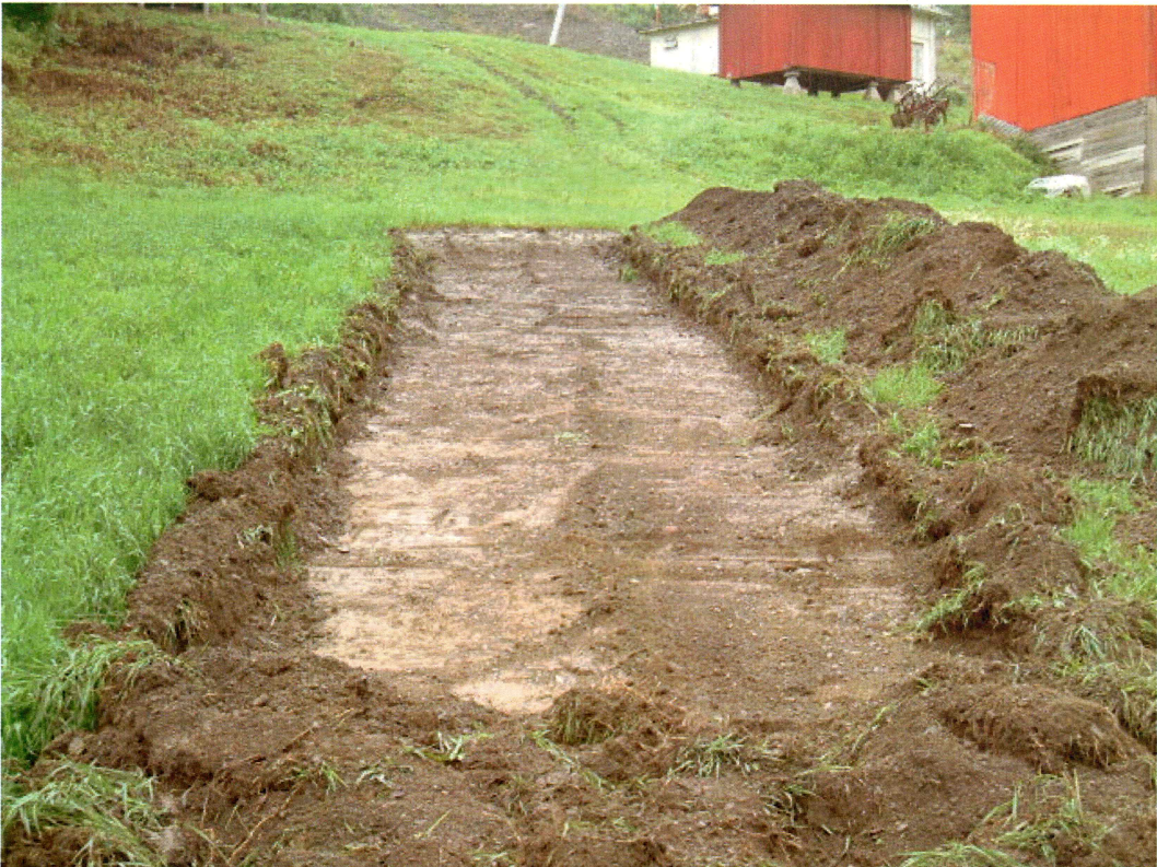
Sjakt 3 (mot SØ)