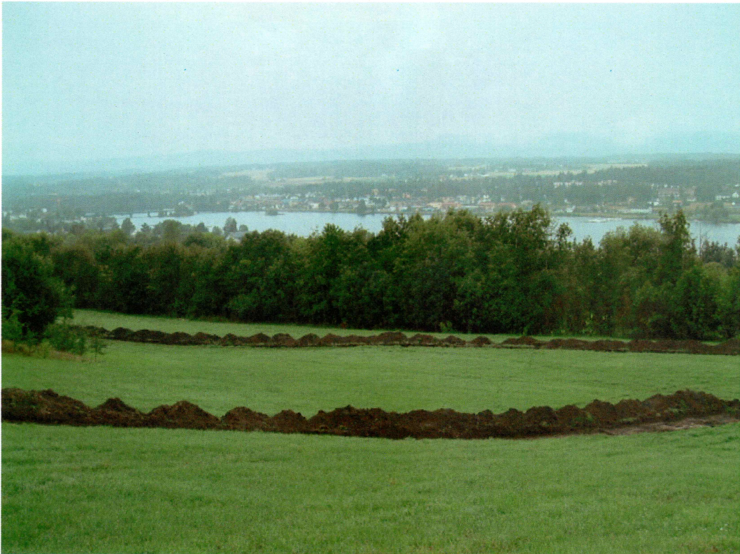
Oversikt sjakt 6 og 7 med Vikersund i bakgrunnen (mot VSV)