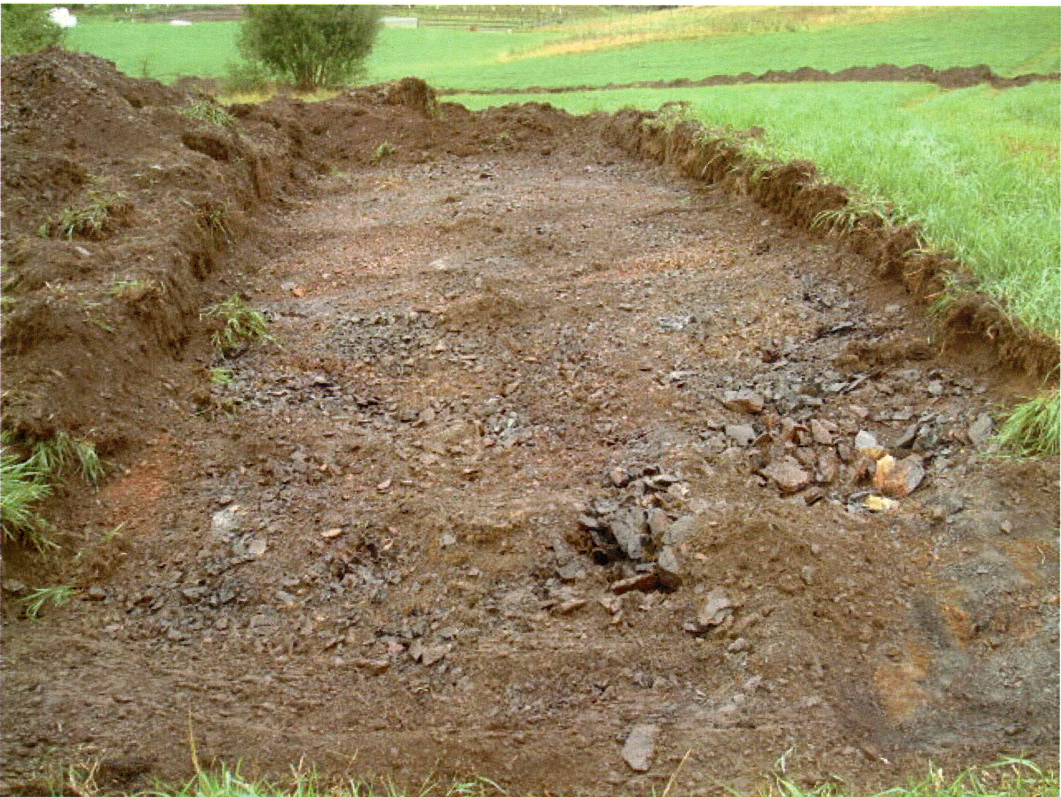
Sjakt 7 (mot N)