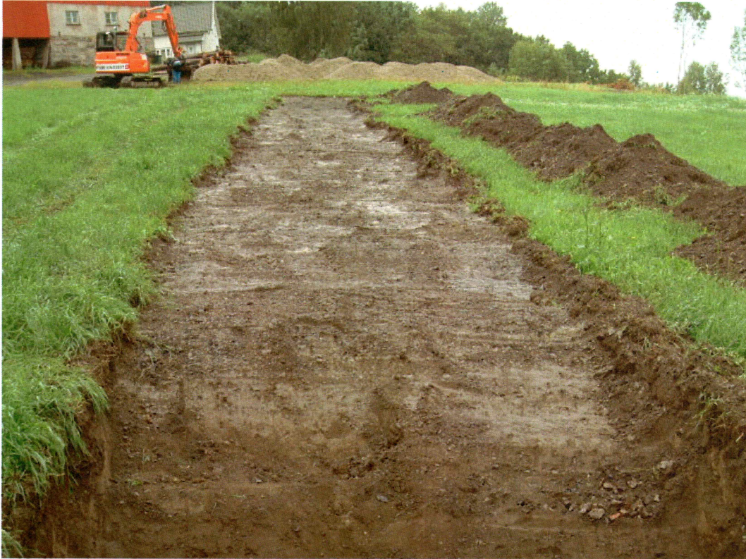
Sjakt 4 (mot SSV)