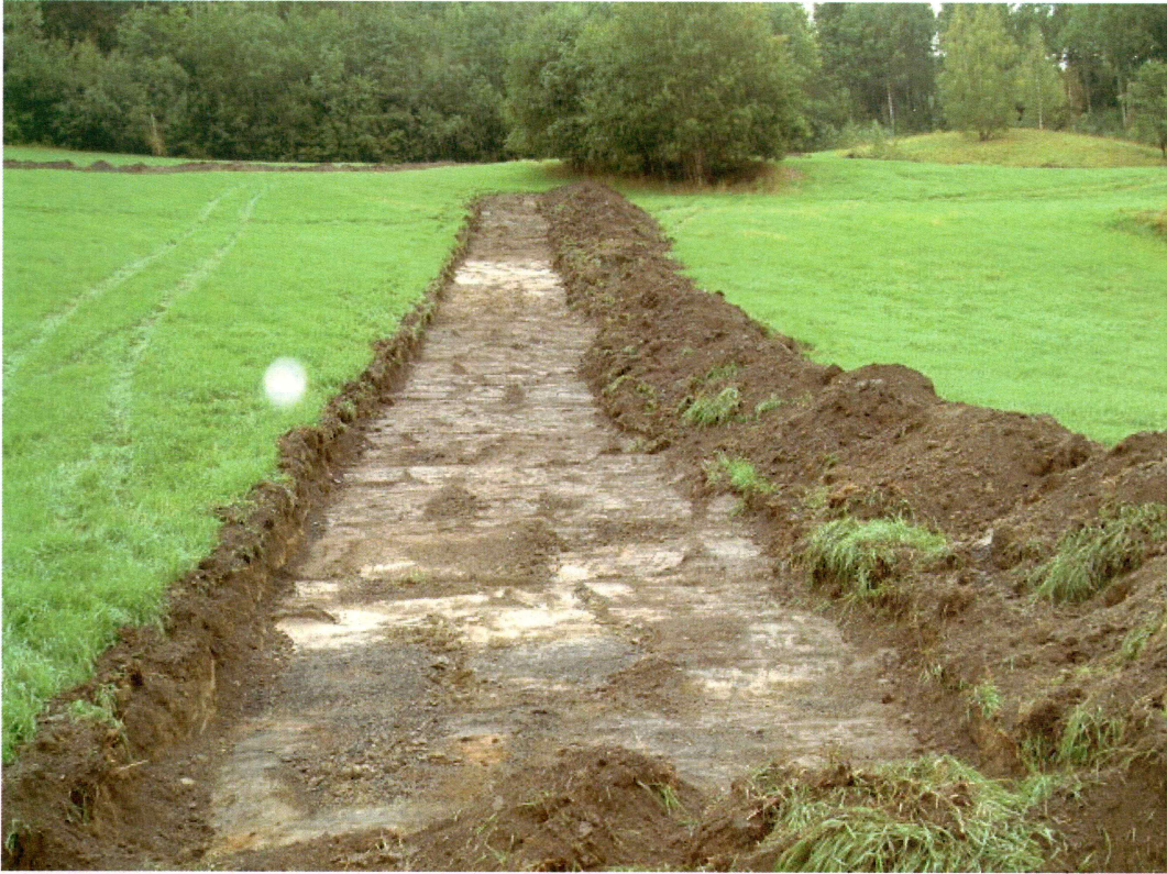
Sjakt 6 (mot SØ)