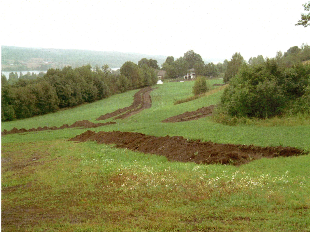
Oversikt sjakt 2-6 (mot N)