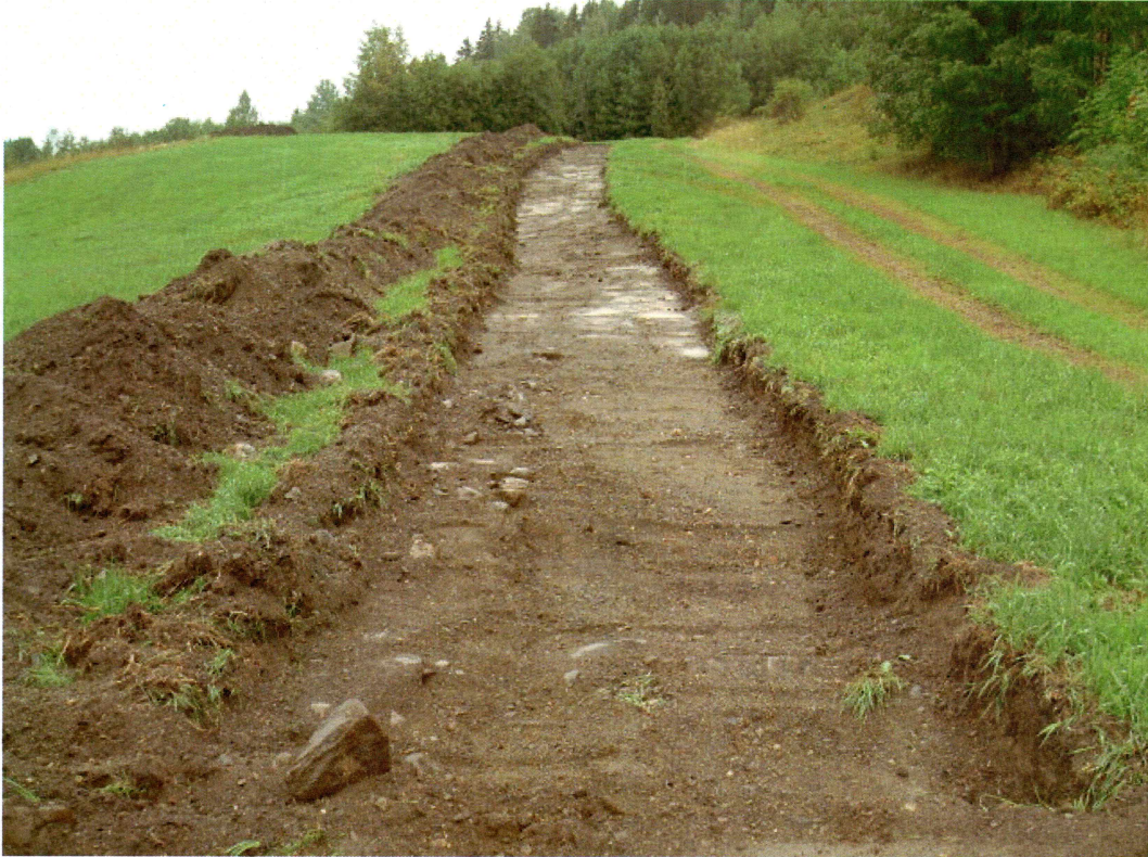
Sjakt 2 (mot NØ)