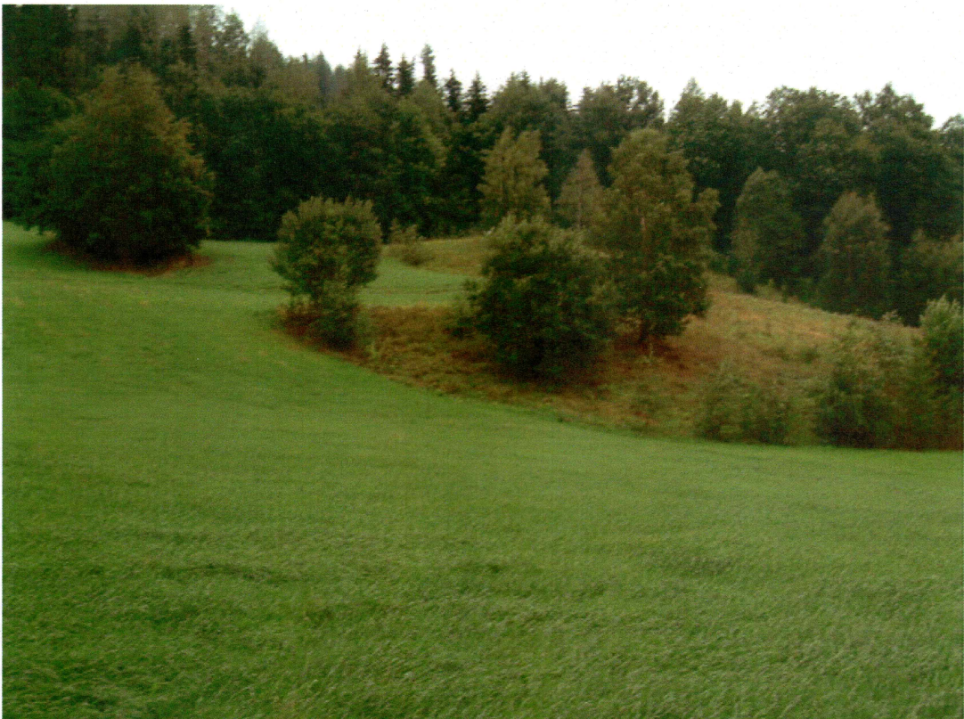
Oversikt over brink i landskapet, hvor sjakt 7 ble anlagt (mot SØ)