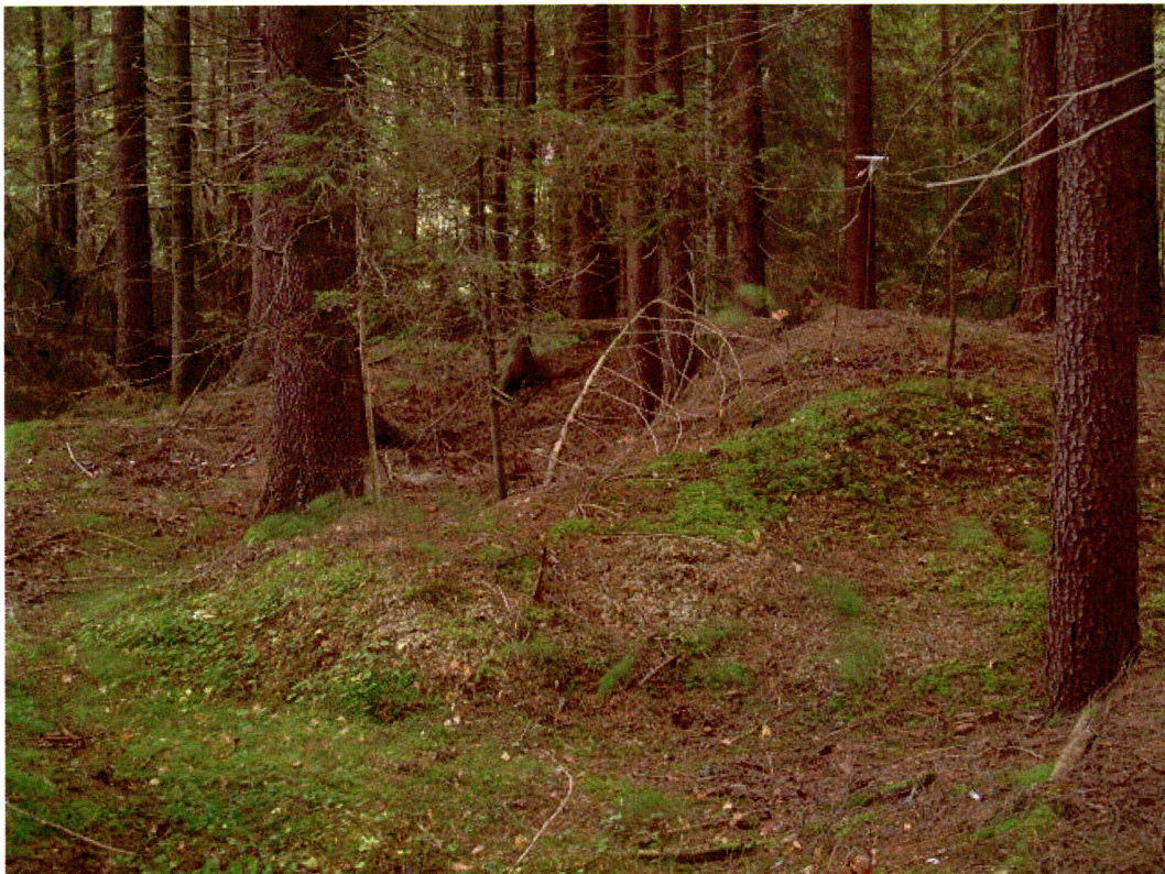
Haugdannelse, sannsynligvis naturlig (mot NØ)