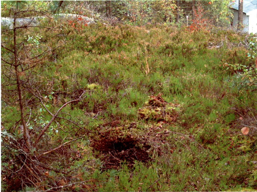
Prøvestikk 6, område 1 (mot N)