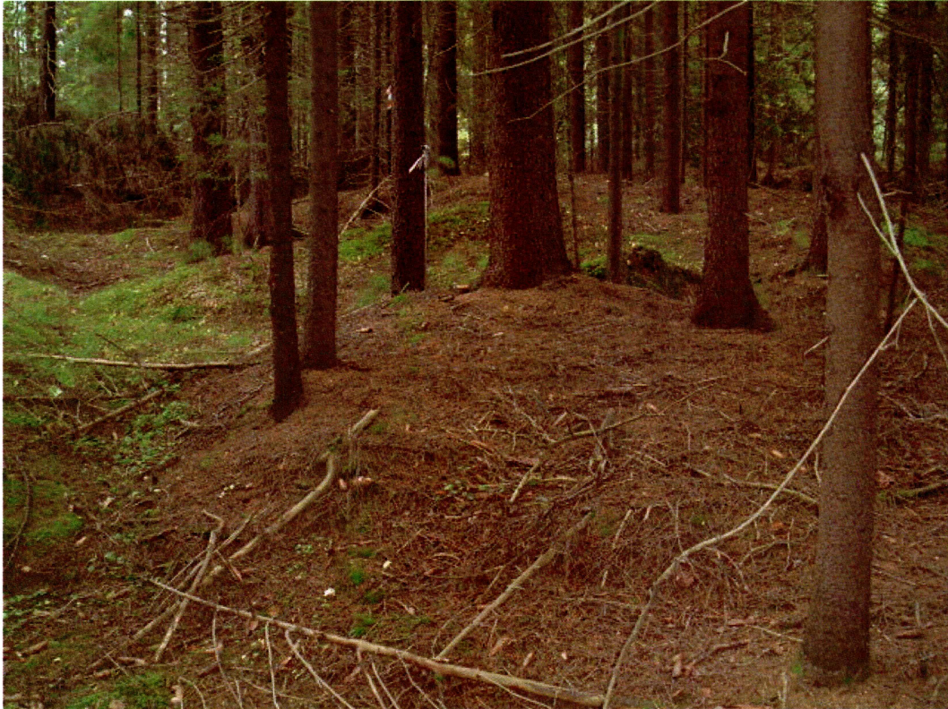
Haugdannelse, sannsynligvis naturlig (mot SV)