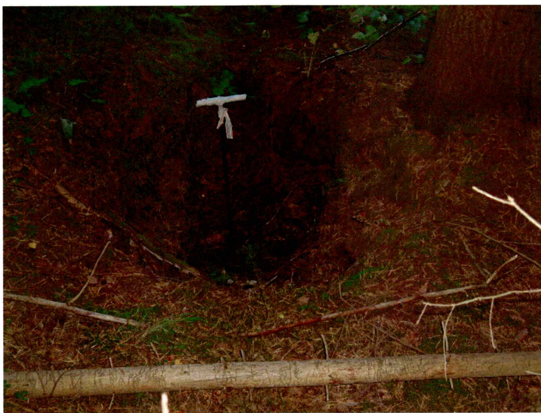
Moderne grop (mot NV)

En grop ble påvist like vest for Rv 35. Denne målte 1,60 m i indre mål, 4,60 m i ytre mål og var om lag 90 cm dyp. Det ble ikke påvist moderne skrot i gropen, men formen og de bratte veggene sannsynliggjør en ung datering. Mangel på kull utelukker en kullgrop, og gropen var altfor liten til å være knyttet til fangst.