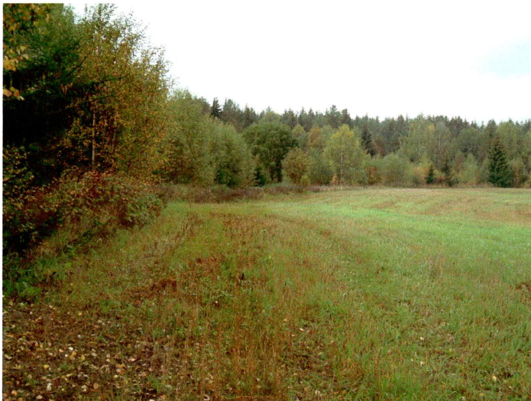
Delvis gjengrodd åker, område 3 (mot VNV)

Denne delen av området besto av dyrket mark. Åkeren begynte å gro igjen med gress, men det var fremdeles mulig å foreta en åkervandring.