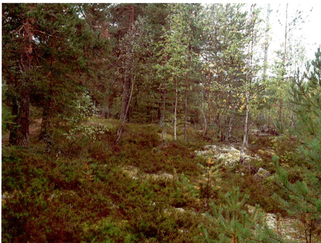
Vegetasjon i område 1 (mot NV)

Bergknausene overfor Drammenselva former flere naturlige ”bukter og nes”, og har derfor stort potensial for littisk materiale.