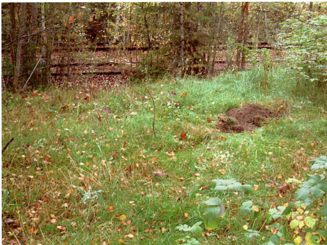
Prøvestikk 2, område 2 (mot SØ)