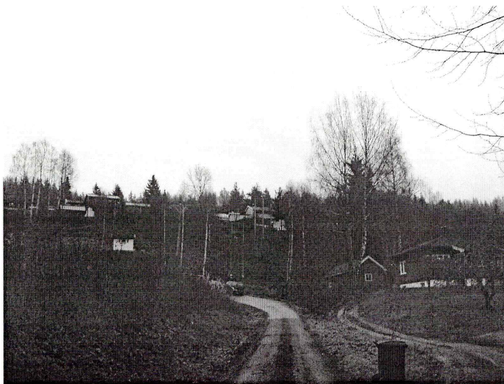
FOTO FRA GLIMMERVEIEN MOT GRANITTVEIEN RETNING SØ

Den østlige delen av planområdet, ved Granittveien, er en utbygd terrasse av berg hvor berget flere steder ligger bart i hagene. Mot vest faller en bratt skråning med tett og lav krattskog hvor det tynne dekket av leire har sluppet berget og rast ut på flere steder. Ut fra skråningen og vest mot G.nr. /Bnr. 53/182 går en naturlig rygg med sand og leire dekket av kratt. Med unntak av skråningen og sandryggen er området berørt av enten husbygging/hager eller vei og parkeringsplasser.