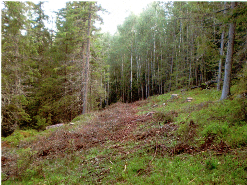
Siste del av nytrase. Sett mot nord. (foto nr 0202).