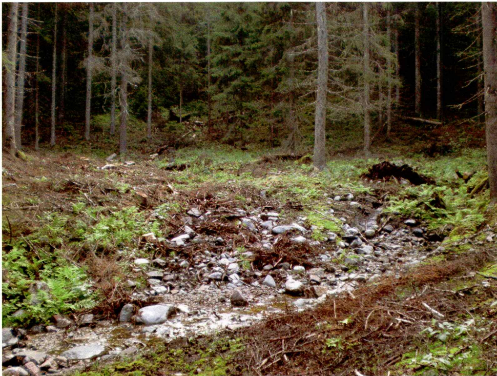
Første del av nytrase. Tatt mor nordøst. (foto nr. 199)

Området er skog og skrår svakt oppover mot øst i starten av traseen. Nyanlegget i øst starter ved en liten bekk og skrår bratt oppover mot øst og svinger videre oppover mot sør. Traseen der nyanlegget planlegges er ferdig hogd ut og det er spor etter maskiner og mye kvist og hogstavfall preger traseen.