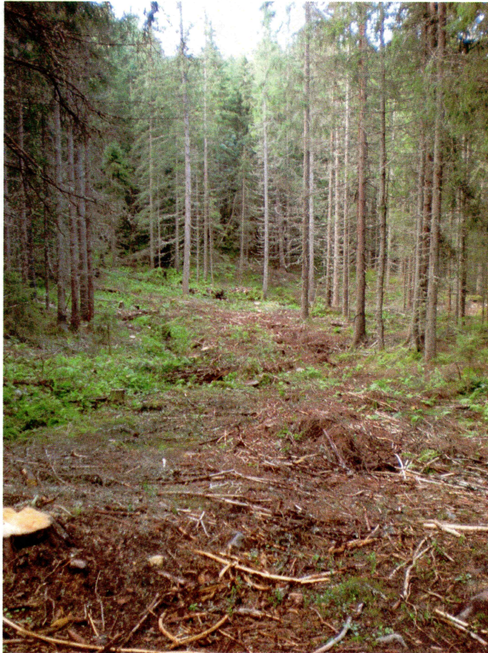
Første del av nytrase. Sett mot sør. (foto nr. 0200)