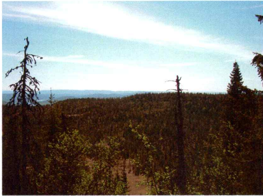
Bilde 1. Illustrerer Skrående terreng mot sør.

Det aktuelle planområdet ble systematisk gjennomgått for funn av nye automatisk fredete kulturminner. Denne gjennomgangen ble gjort systematisk ved å gå i sløyfer fra nord mot sør med utgangspunkt i den østligste delen av området. Det kunne ikke påvises automatisk fredete kulturminner innefor planområdet. Dette da terrenget hovedsakelig er som brattmark og blokkmark og regne.