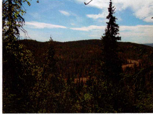
Bilde 2. Illustrerer blandingsskog og skrående terreng mot vest