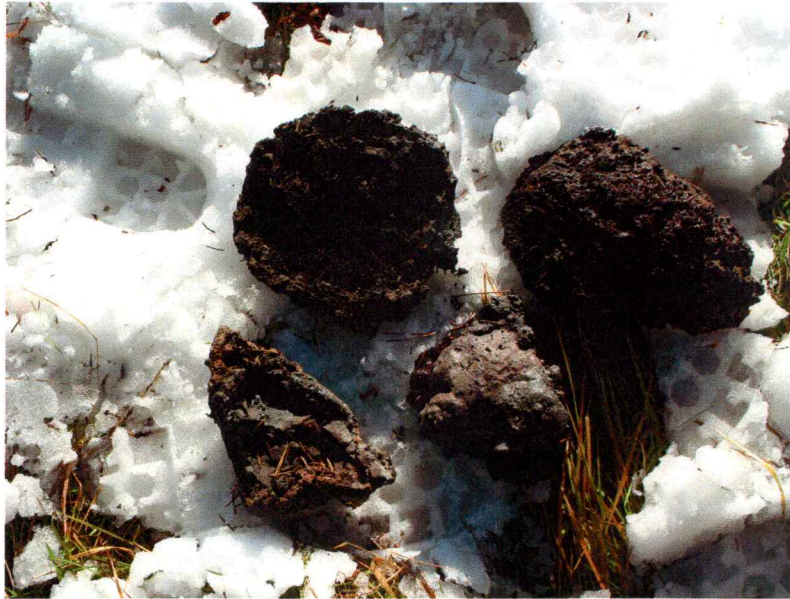
Detalj bilde av slagg fra smia. Øverst på bildet vises to bunnskoller, nederst på bildet vises slagg med såkalt "sintret" overflate.