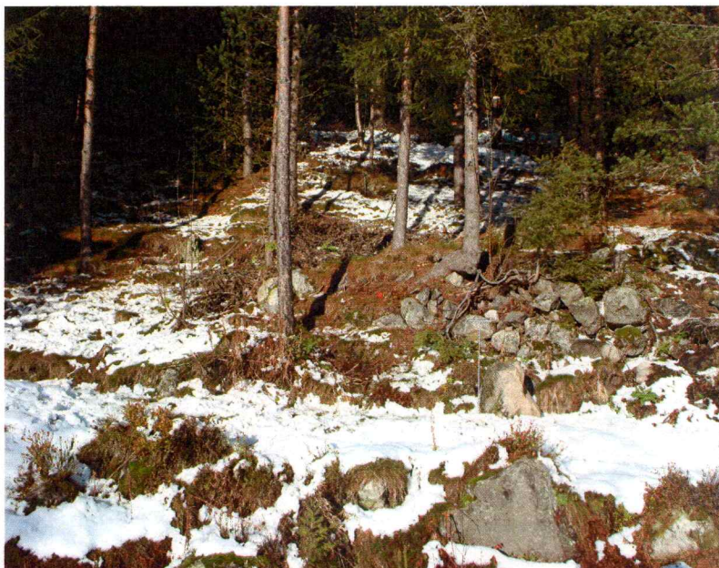
Oversiktsbilde av smia og rydningsrøysa. På bildet ligger smia like til venstre for røysa. Bildet er sett mot nord.

Når det gjelder den moderne steinrøysa er trolig de øverste steinene ryddet i forbindelse med bygging av traktorveien. Steinrøysa synes imidlertid å være oppmurt i mot nord, vest og øst, og har en rektangulær form på 4,5 x 2 meter. Selve oppmuringen kan være rester etter ei tuft fra smievirksomhet, som i nyere tid er forstyrret ved rydding av større steiner.