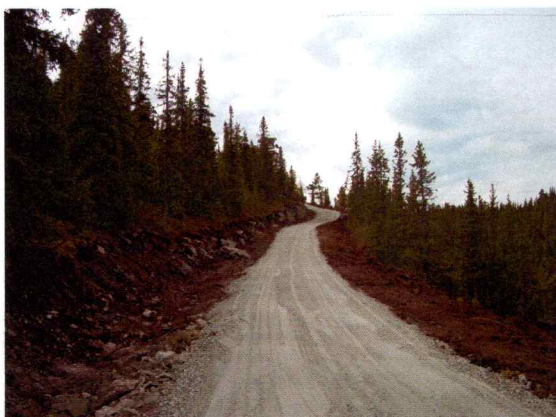
Bilde 1. Viser den påbegynte anleggsveien i området.