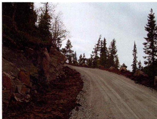
Bilde 2. Viser den påbegynte anleggsveien i området.