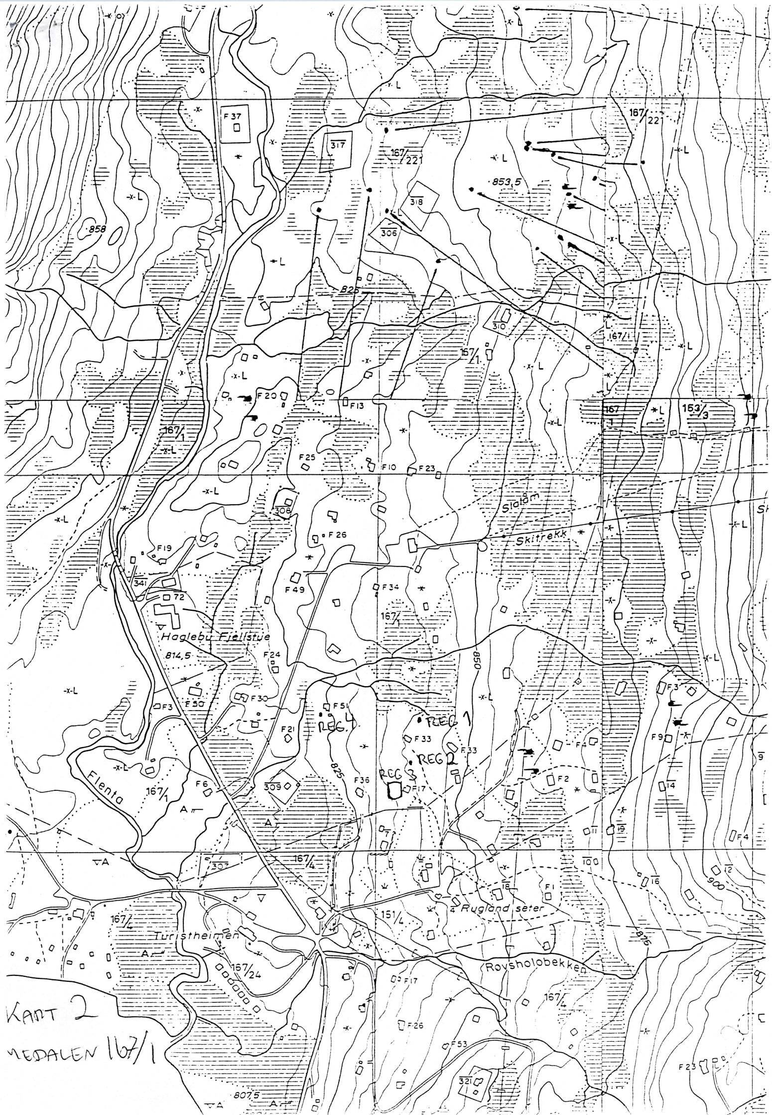
KART 2 MEDALEN 167/1