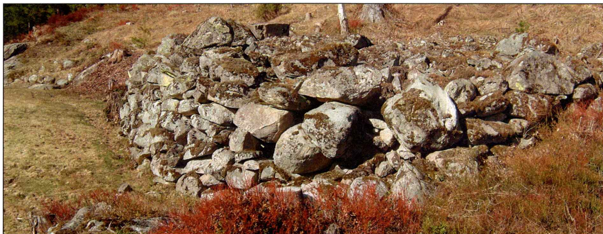
X 13, rydningsrøys.

GPS-posisjon: 32 V 0522059 UTM 6670832 ± 6 m.