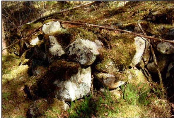
X 2, rydningsrøys.

GPS-posisjon: 32 V 0522215 UTM 6670676 ± 6 m.