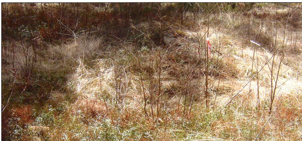
X 1 sett fra vest, og hvor den østlige muren ses lengst bak i strukturen.

GPS-posisjon: 32 V 0522221 UTM 6670636 ± 7 m.