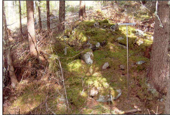
X 3, rydningsrøys.