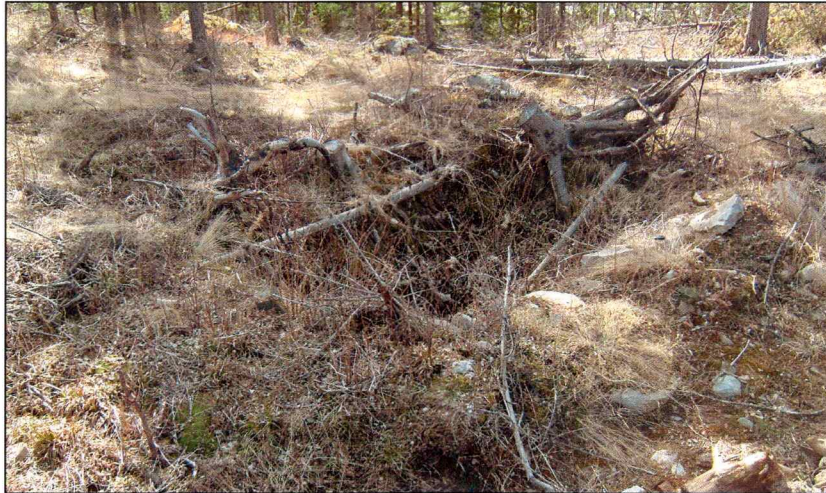
X 6 grop tolket som kjeller i husmannsplasstuft.

GPS-posisjon: 32 V 0522270 UTM 6670733 ± 5 m.