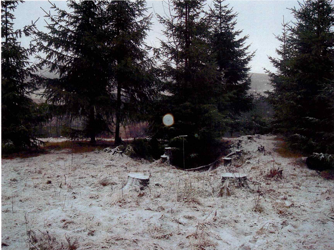
Bilde 1. Bilde tatt av tufta mot vest. Husmannsplassen er lokalisert nordvest på planområdet. Tufta målte omtrentlig 4x5 meter og var 50 cm dyp. Synlige syllstein i bakkant, mens den nordre delen av veggen var rast inn i tufta.

Hele området ble grundig befart jf § 9 i kulturminneloven av 9 juni 1978 uten å påvise automatisk fredete kulturminner. Det ble imidlertid registrert en husmannsplass som skriver seg til nyere dato (kart 2 og bilde 1). Denne lokaliteten kunne bekreftes av grunneier av området. Husmannsplassen ble målt inn og kartfestet digitalt med GPS. Den gjenværende tufta fra denne lokaliteten målte 4x5 meter og var rektangulær av form. Nordsiden av tufta var rast ut, mens vestsida av tufta kunne man fortsatt se steinsettingen til syllstokkene. Grunneier mente at husmannsplass ble fraflyttet på 1940 – tallet.