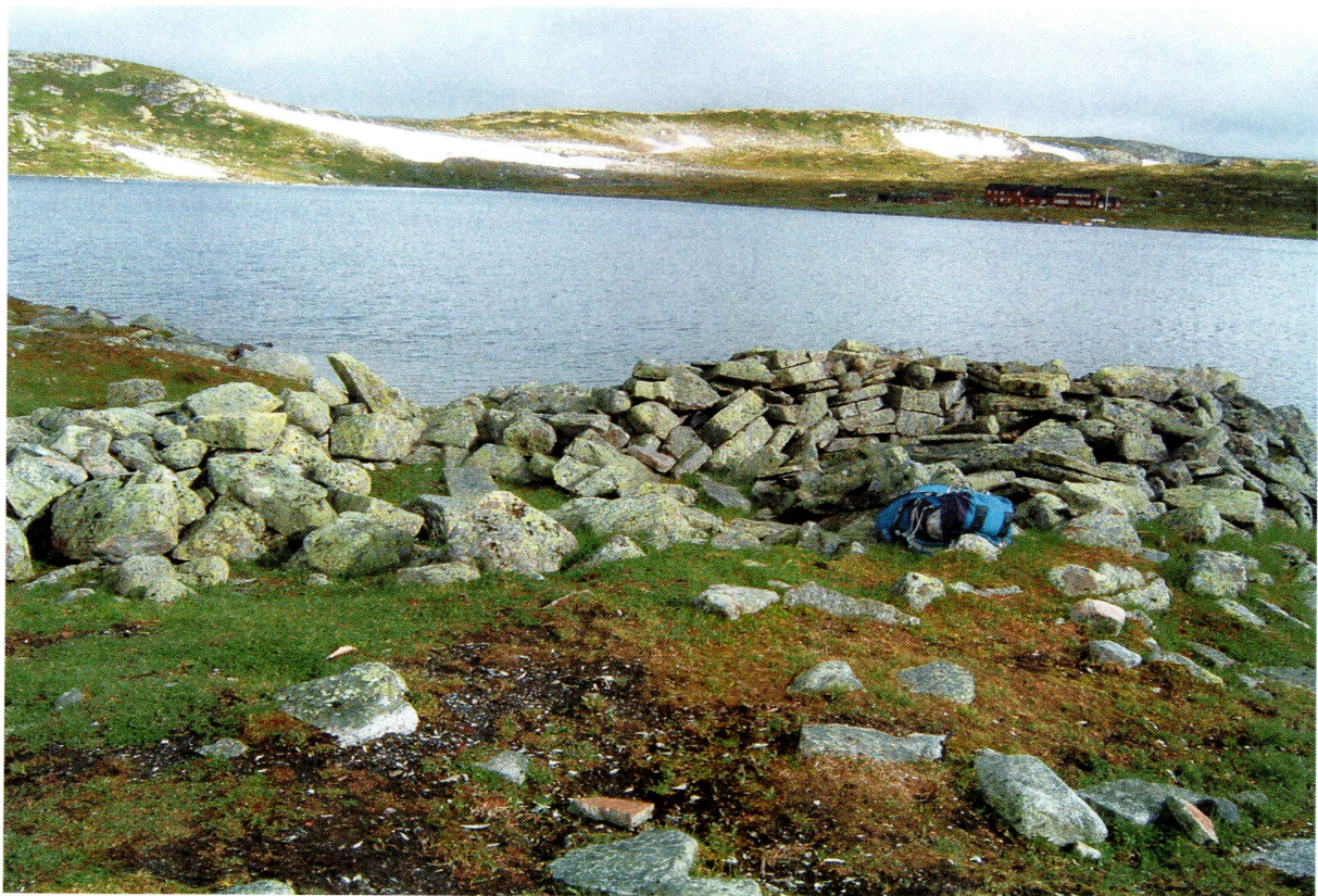
Tufta sett mot nordvest. Området med slakteavfall i forgrunnen. Det ligger store mengder bein, tenner og gevir innenfor et område som måler ca 6x8 meter. Det ble ikke gjort noen forsøk på å grave, men det stikker opp bein i alle bare flekker.