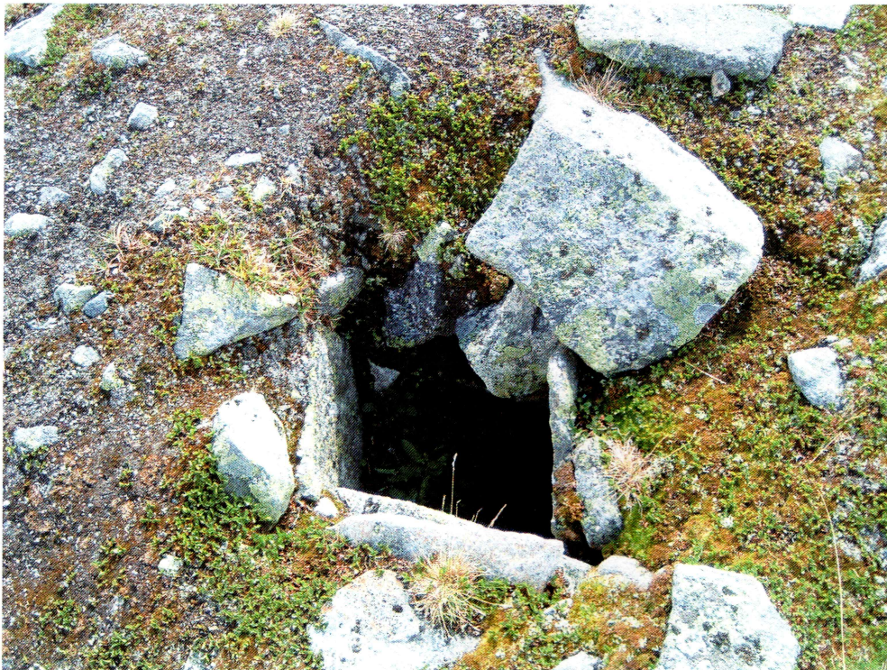
En av kjøttgropene.