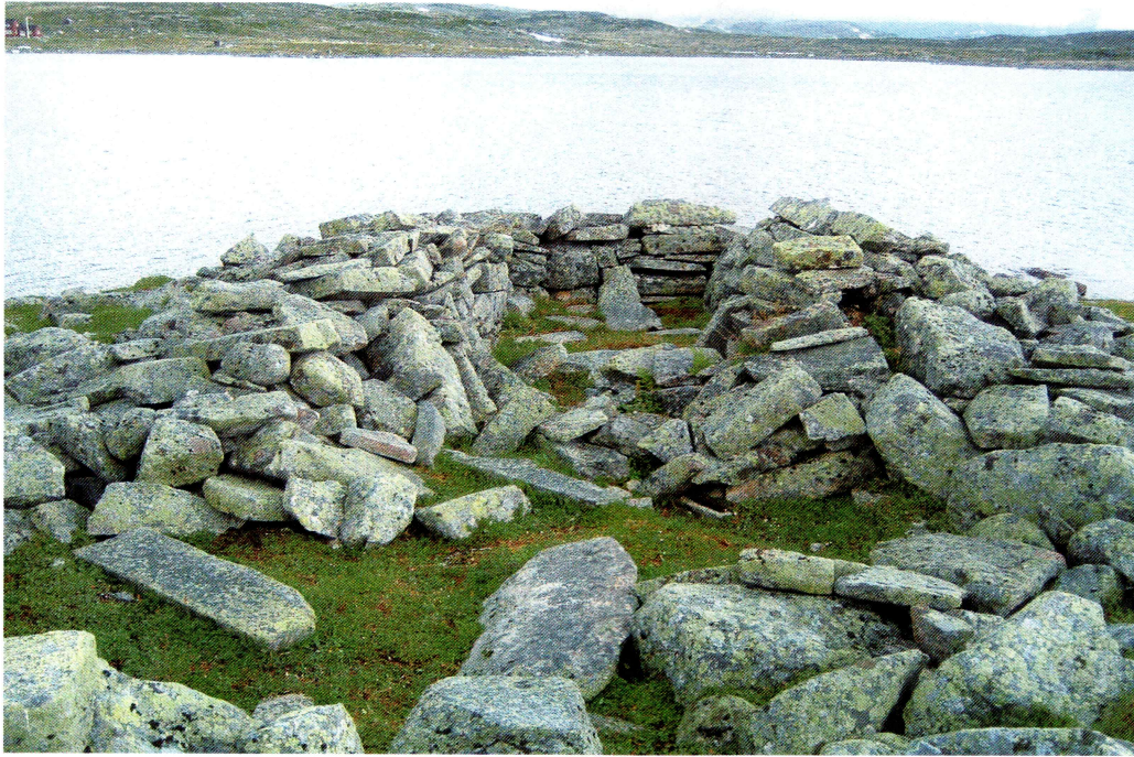
Tufta sett mot nord. Rommet lengst bort er ikke bredere enn 1,5 meter innvendig.