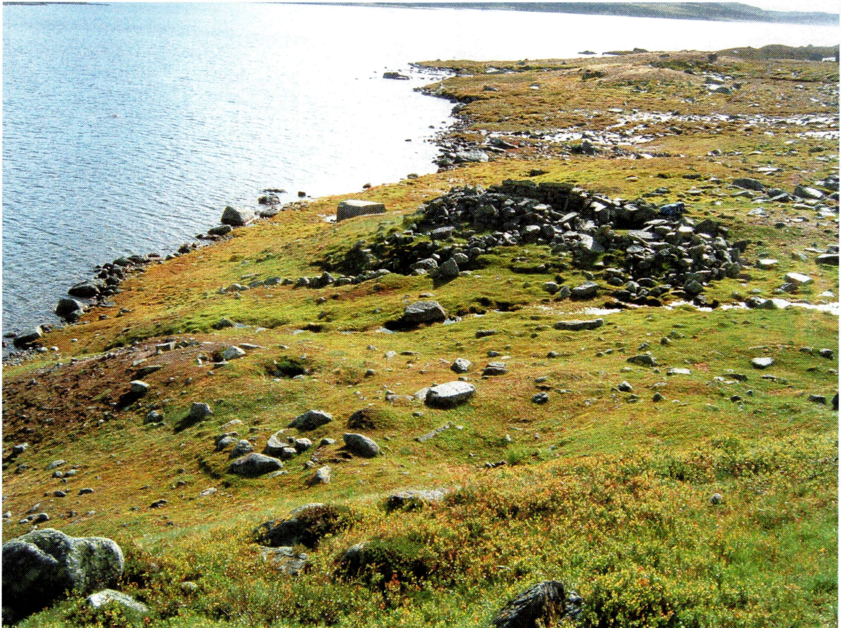
Tufta sett mot øst. Til venstre i bildet, på vestsiden av bekken, ligger fire kjøttgroper på rekke.